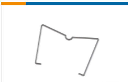
TE 产品编号1419108-7 RT28516