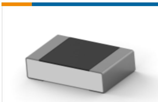
TE 产品编号7-2176374-3 RQ 0805 604R 0.1% 10PPM 1K RL