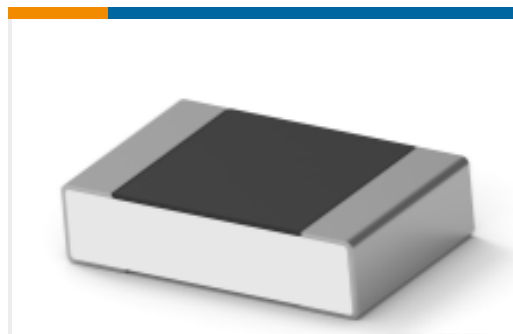
TE 产品编号3-2176373-2 RQ 0805 21R 0.1% 10PPM 1K RL BR