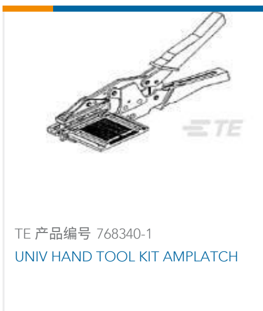
TE 产品编号 768340-1 UNIV HAND TOOL KIT AMPLATCH