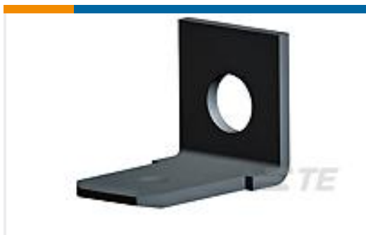
TE 产品编号141879-1 250 FASTON,TAB,BR