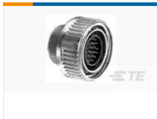
TE 产品编号 208492-1 PLUG ASSY, SZ 22, CMC