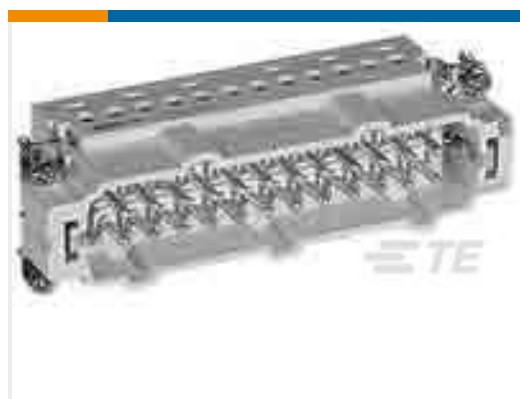
TE 产品编号 1-1103640-1 HE.24.STI.S.1-24