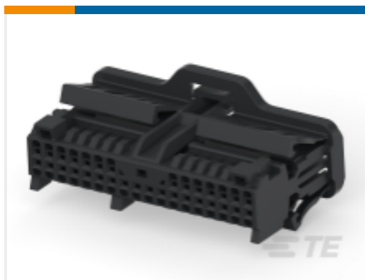
TE 产品编号 2303088-2 32POS, NANOMQS, REC HSG, UNSLD, COD A, FFC