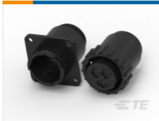
TE 产品编号 CAT-AM71-C83998BB CPC 系列 3