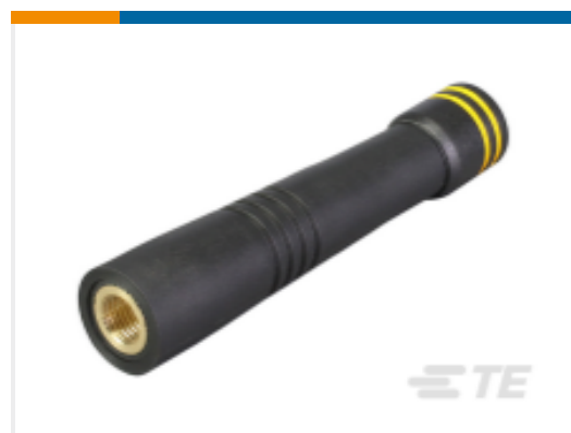
TE 产品编号 ANT-916-CW-HD Antenna 1/4 Wave HD Whip 916MHz RPS