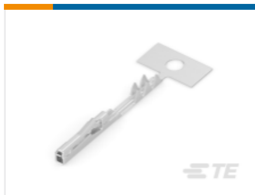
TE 产品编号 1-2291853-1 NANO MQS CONTACT FFC, FPC