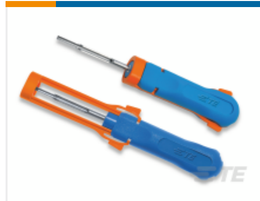
TE 产品编号 1579007-9 EXTRACTION TOOL