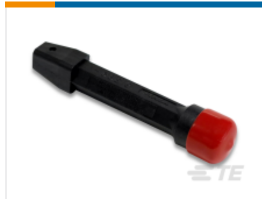
TE 产品编号 91285-1 INSERT/EXTRACT TOOL ASSEMBLY