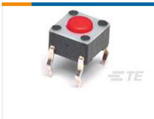
TE 产品编号 1-1825910-8 FSM10JH=6MM TACT SWITCH, HIGH TEMP