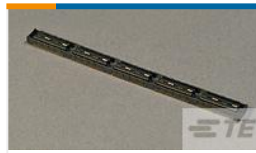
TE 产品编号 1658462-5 MSB0.80RC-ASY200FL,-,30,-TY