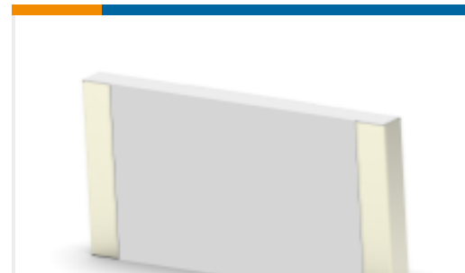
TE 产品编号7-2176246-6 CRGS2512 5% 1M8