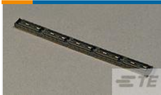
TE 产品编号 2-1658043-5 MSB0.80RC-ASY200FL,-,F,-TY