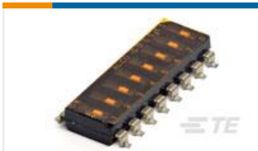
TE 产品编号1-1825006-9 GDS10S04=DIP SW,SLIDE,SMT