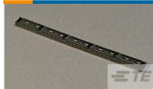
TE 产品编号 2-1658462-5 MSB0.80RC-ASY200FL,-,30,-TY