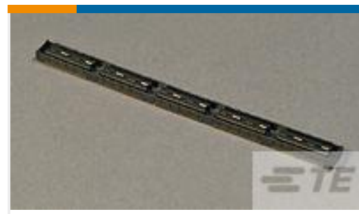
TE 产品编号 1658043-5 MSB0.80RC-ASY200FL,-,F,-TY