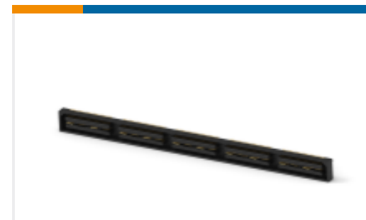
TE 产品编号 2-1658012-5 MSB0.80RC-ASY200FL,-,10,-TY