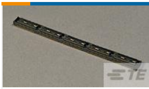
TE 产品编号 1658012-5 MSB0.80RC-ASY200FL,-,10,-TY