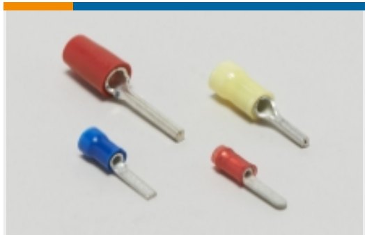
压接电线插针、公端和插针(41)