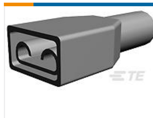
TE 产品编号735159 250 PIDG FF