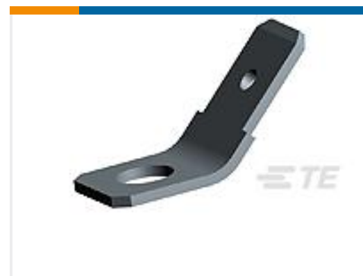
TE 产品编号140814-1 250 FASTON,TAB,BR