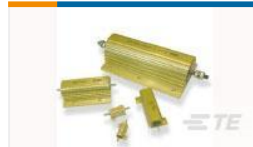
TE 产品编号1625971-5 HSA25 10R 5%