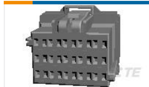
TE 产品编号8-968973-1 MCP2.8 GEH 15P