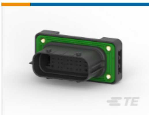
TE 产品编号SRK02-MDC-32A-001 REC, 32P, BLK, E, FLANGE, C