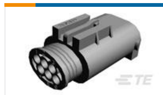
TE 产品编号2-967587-3 6POS MQS TAB SEALED COD B