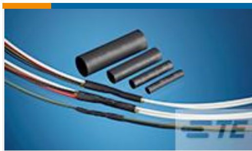
TE 产品编号CH03396001 RBK-ILS-125-3A-0-50MM