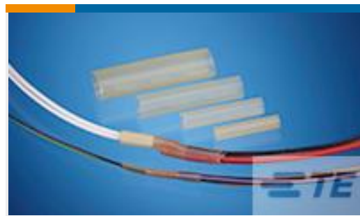
TE 产品编号7121976007 RBK-VWS-125-NR3-X-50MM