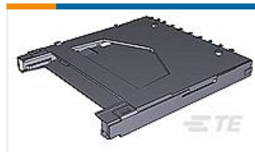
TE 产品编号1871916-1 SD RVS 0H EMOSS ASSY