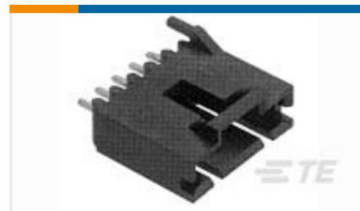
TE 产品编号5-104809-4 05 MTE HDR SRST LATCH W/HLDWN