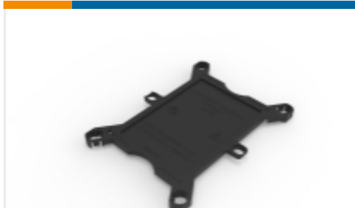
TE 产品编号2305234-1 SOCKET P HARDWARE DUST COVER