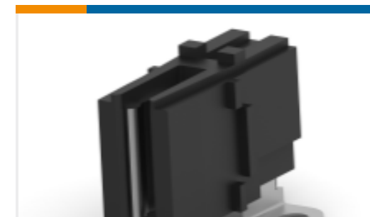
TE 产品编号1982995-3 CROWN CLIP JUNIOR SCREW-MOUNT CONN