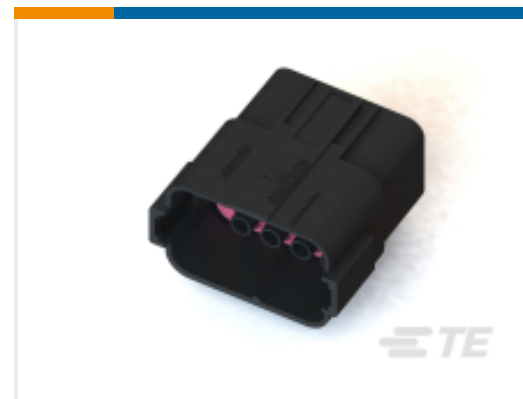
TE 产品编号ZPF000000000136485 RECEPTACLE MALE FOR 12 PINS, CAL1,6