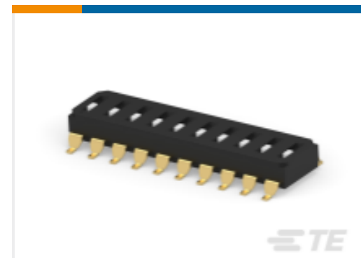
TE 产品编号3-2319848-1 END STACK DIP 10P G RECESS SEAL TUBE