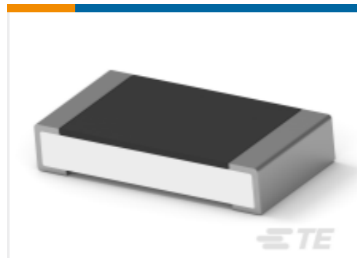
TE 产品编号4-2176391-7 RQ 1206 37K4 0.1% 10PPM 5K RL