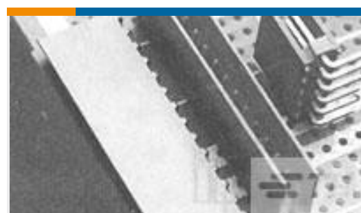
TE 产品编号281698-3 HEADER HE14 RA 3 P