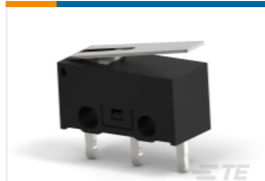
TE 产品编号2351445-4 UMINSA SW HLV0.88N 3A/1.5A AC SC PCB