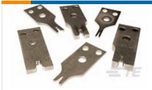
TE 产品编号8-2119784-2 CRIMPER INSULATION O PREMIUM