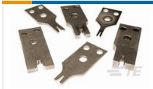
TE 产品编号2119784-2 CRIMPER, INSUL O PREMIUM