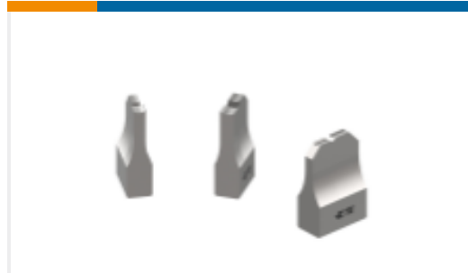
ANVIL REPRESENTATION ONLY TE 产品编号9-1633933-0 ANVIL, COMBINATION