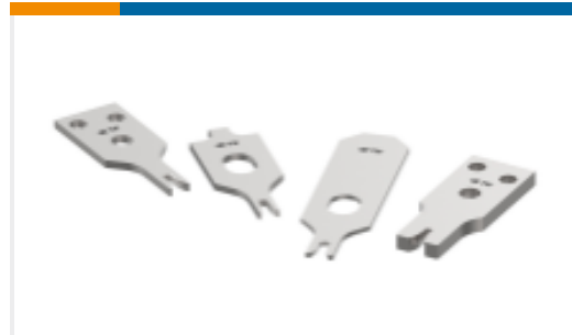
CRIMPER REPRESENTATION ONLY TE 产品编号1-1803125-5 CRIMPER, WIRE F NON-TYPICAL RK VALUES