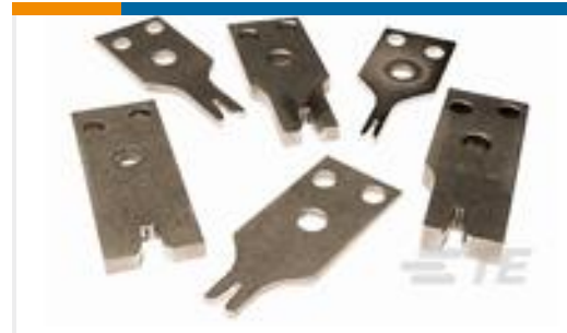
TE 产品编号1-456405-6 CRIMPER WIRE .080 F