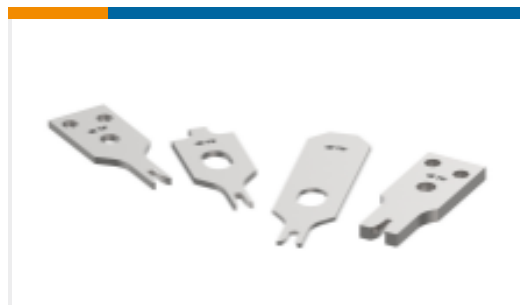
CRIMPER REPRESENTATION ONLY TE 产品编号8-1722380-9 CRIMPER, FERRULE 180 DEGREE