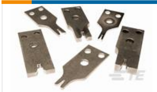
TE 产品编号1633169-3 CRIMPER, WIRE, SPEC (.070" 'F')