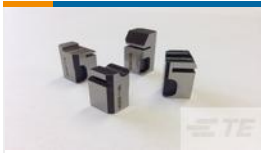
TE 产品编号462006-6 FLOATING SHEAR