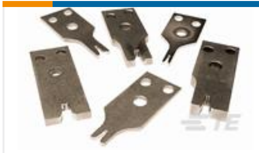
TE 产品编号1-1673600-0 CRIMPER, WIRE (.050" 'F')