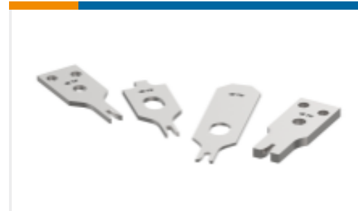
CRIMPER REPRESENTATION ONLY TE 产品编号1803702-2 CRIMPER, INSULATION OVERLAP PREMIUM