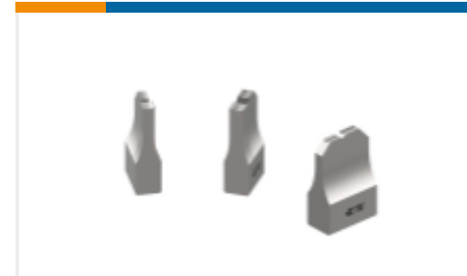
ANVIL REPRESENTATION ONLY TE 产品编号2-1803764-7 ANVIL, COMBINATION