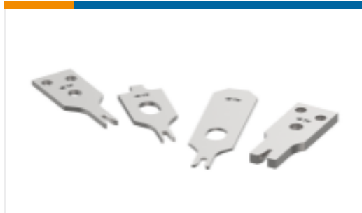
CRIMPER REPRESENTATION ONLY TE 产品编号4-1633966-0 CRIMPER,INSULATION O