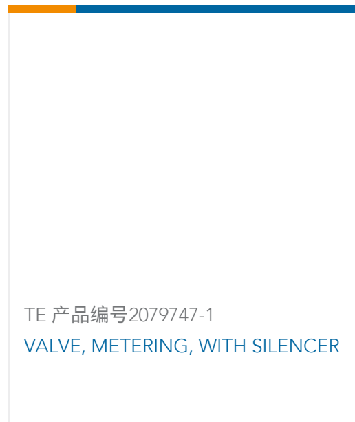
TE 产品编号2079747-1 VALVE, METERING, WITH SILENCER