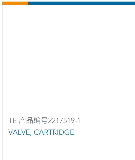
TE 产品编号2217519-1 VALVE, CARTRIDGE