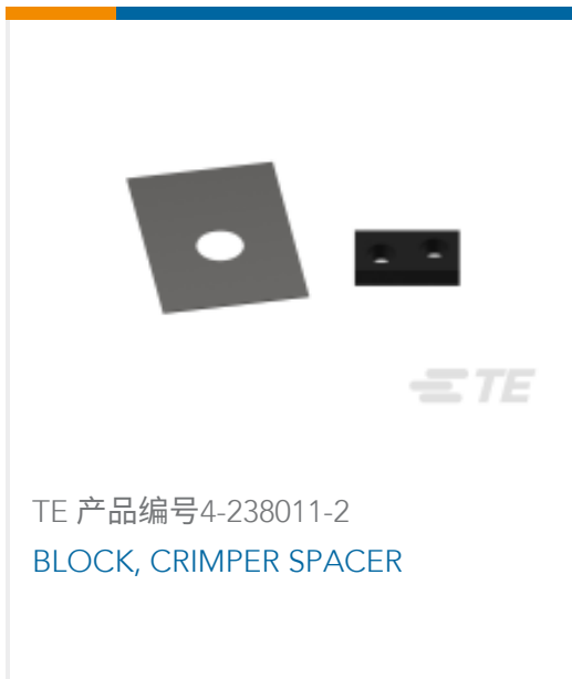
TE 产品编号4-238011-2 BLOCK, CRIMPER SPACER