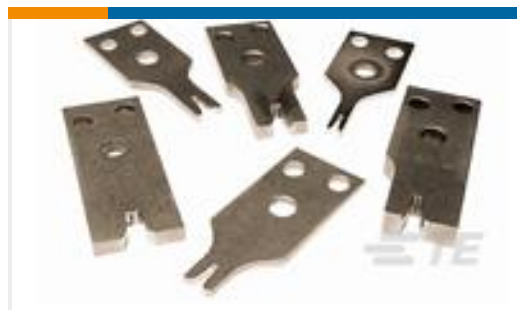
TE 产品编号3-1633730-2 CRIMPER, WIRE F .055F