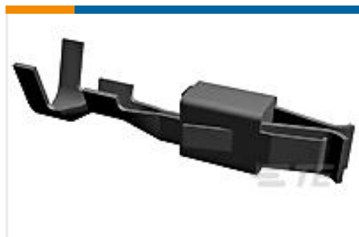
TE 产品编号929941-1 JPT REC 2.8 Contact SWS Sn