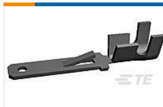
TE 产品编号60294-2 FF 250 TAB 22-18 AWG .032 TPBR