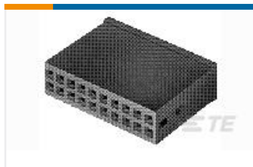
TE 产品编号1-925369-6 MOD 4 REC.HSG 1X16P