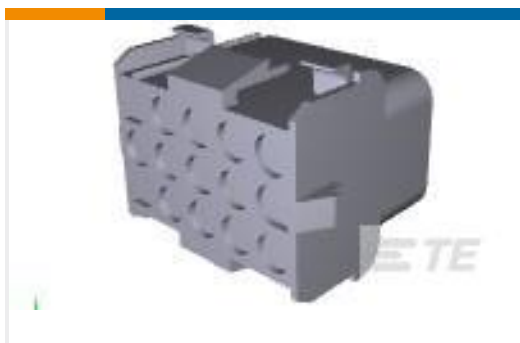
TE 产品编号926647-3 UNIV.M-N-L.CAP HSG