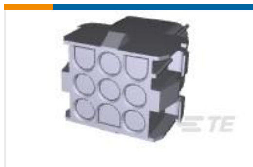
TE 产品编号927231-3 HONHUS UMNL V0 9-P