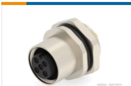
TE 产品编号T4133012051-000 M12,FRONT MOUNT,FEMALE,A,5P, SOLDER WIRE