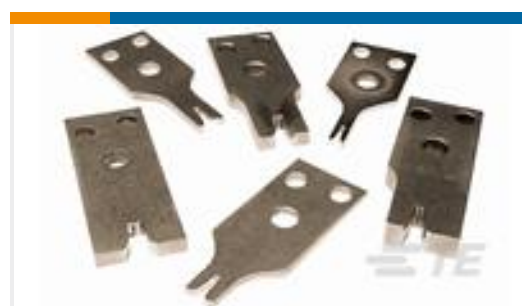
TE 产品编号1-456404-6 CRIMPER WIRE .070 F