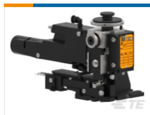
TE 产品编号 2266335-2 OCEAN_2.0_APPLICATOR-S- 055F0700-RSA