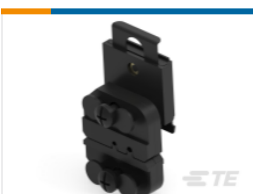
TE 产品编号 2384426-2 SDE F TYPE III+ 0.56-0.12mm2 DIE SET