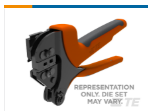
TE 产品编号 2384426-1 SDE F TYPE III+ 0.56-0.12mm2 ASSY