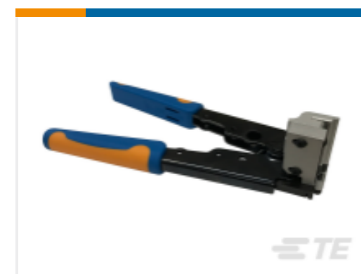
TE 产品编号 2305570-1 Strip Terminal Cutter-Side Feed-No Crimp