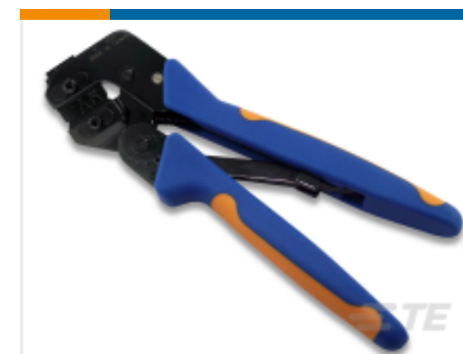
TE 产品编号 58495-1 PRO CRIMPER ASSY MULTIMATE