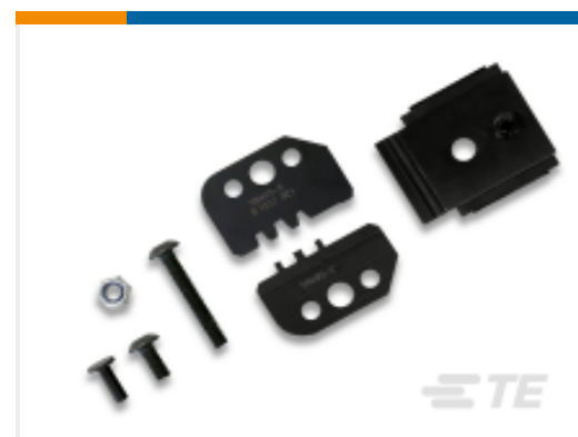
TE 产品编号 58495-2 PROCRIMPER DIE ASSY MULTIMATE