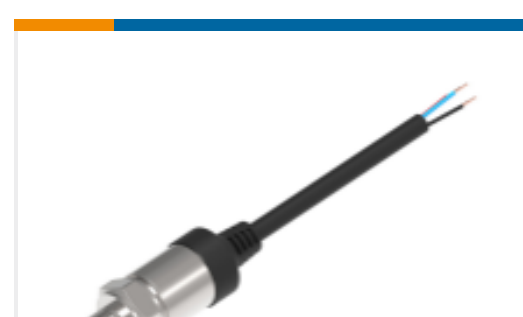
TE 产品编号20014203-12 PRESS XDCR M325M-000005-250PG