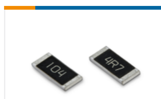
TE 产品编号2-2176455-5 CPF 0402 7R5 0.1% 25ppm 1K RL