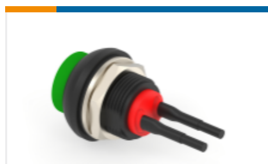
TE 产品编号2329359-9 PB ON/OFF HC GRE M1 TERM IP68 500MM LHS