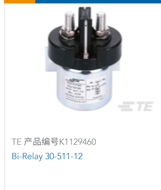
TE 产品编号K1129460 Bi-Relay 30-511-12