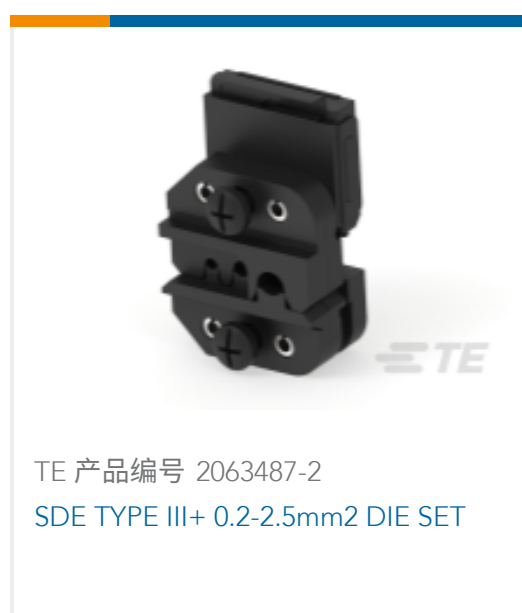
TE 产品编号 2063487-2 SDE TYPE III+ 0.2-2.5mm 2 DIE SET