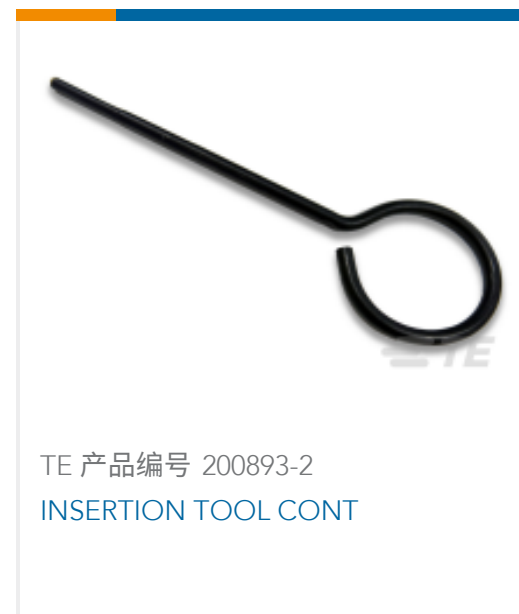
TE 产品编号 200893-2 INSERTION TOOL CONT