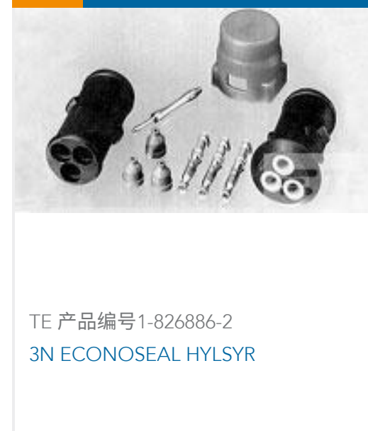
TE 产品编号1-826886-2 3N ECONOSEAL HYLSYR