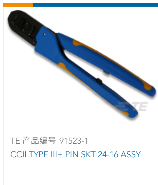
TE 产品编号 91523-1 CCII TYPE III+ PIN SKT 24-16 ASSY