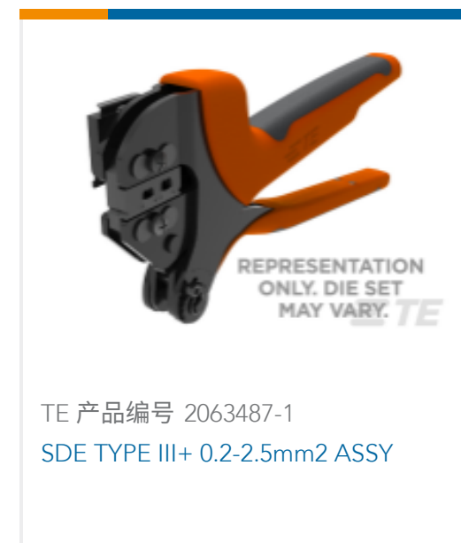
TE 产品编号 2063487-1 SDE TYPE III+ 0.2-2.5mm 2 ASSY