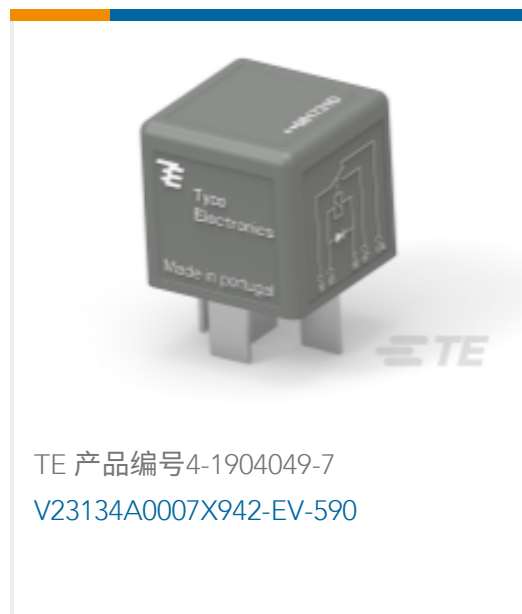
TE 产品编号4-1904049-7 V23134A0007X942-EV-590