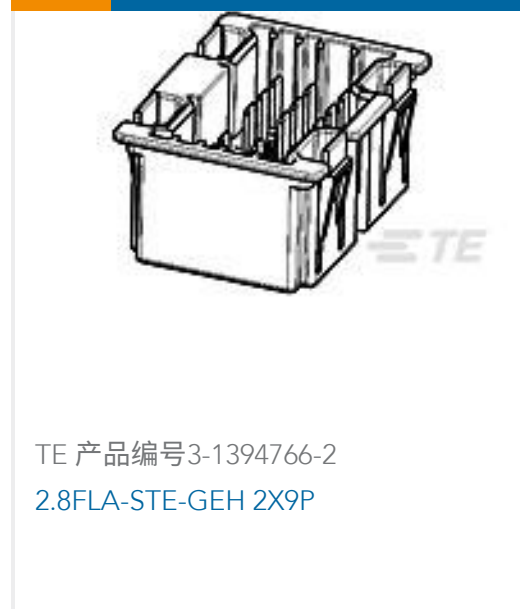
TE 产品编号3-1394766-2 2.8FLA-STE-GEH 2X9P