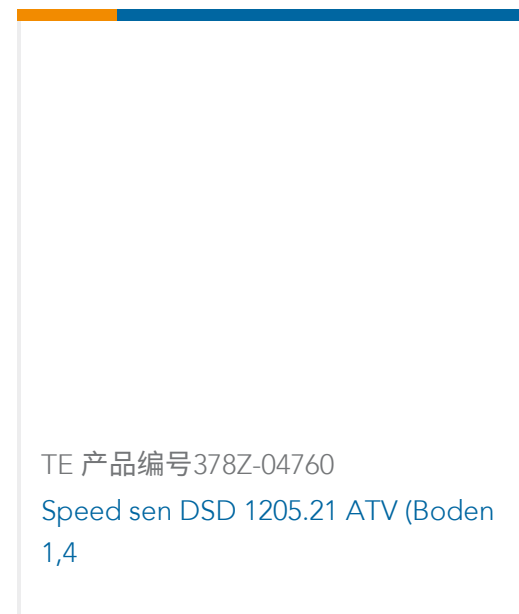
TE 产品编号378Z-04760 Speed sen DSD 1205.21 ATV (Boden 1,4