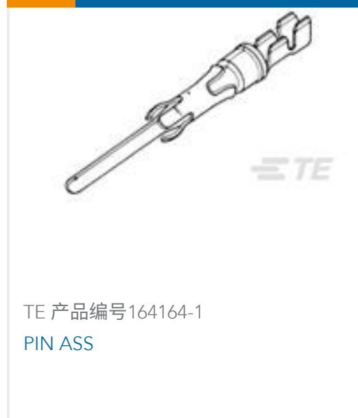
TE 产品编号164164-1 PIN ASS