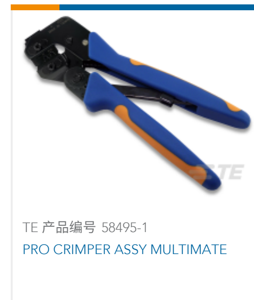
TE 产品编号 58495-1 PRO CRIMPER ASSY MULTIMATE