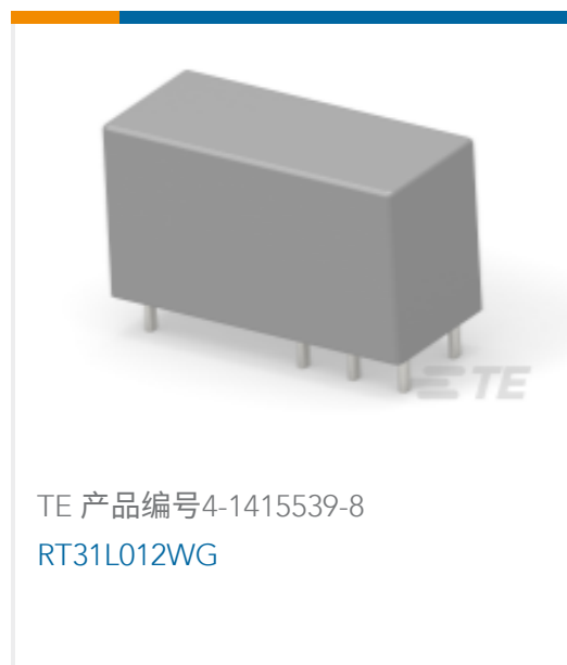
TE 产品编号4-1415539-8 RT31L012WG