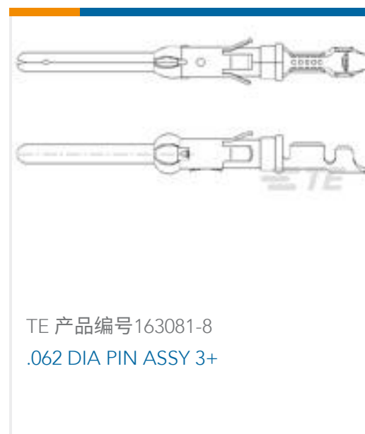
TE 产品编号163081-8 .062 DIA PIN ASSY 3+