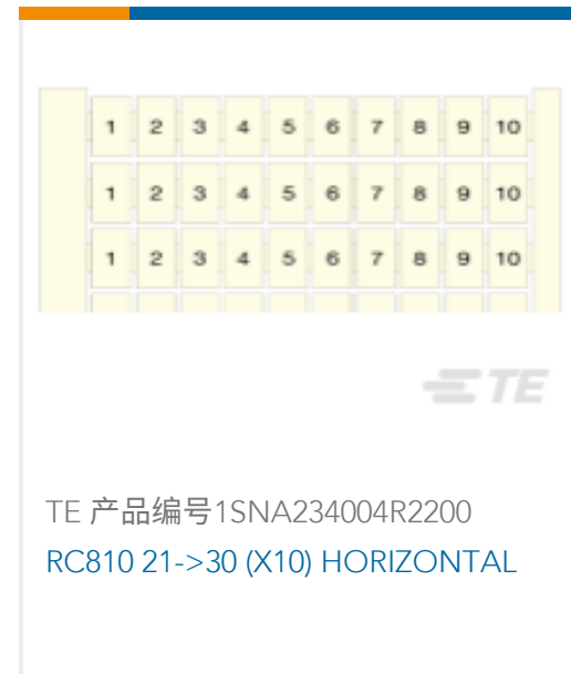
TE 产品编号1SNA234004R2200 RC810 21->30 (X10) HORIZONTAL