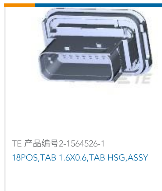
TE 产品编号2-1564526-1 18POS,TAB 1.6X0.6,TAB HSG,ASSY