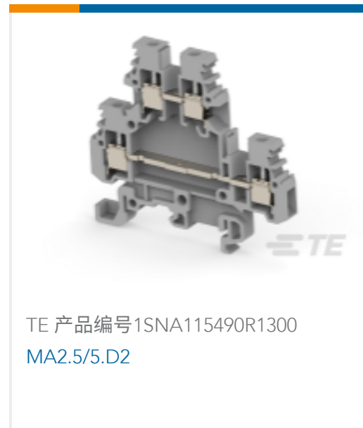
TE 产品编号1SNA115490R1300 MA2.5/5.D2