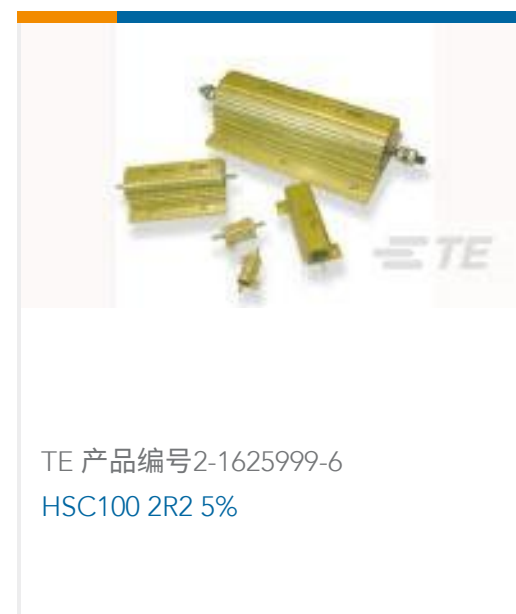
TE 产品编号2-1625999-6 HSC100 2R2 5%