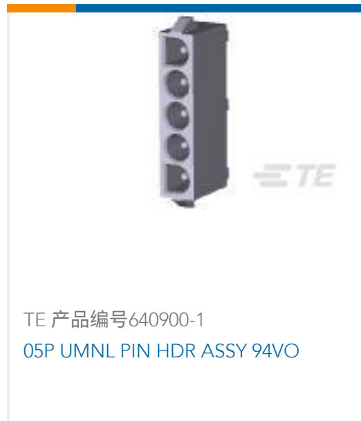
TE 产品编号640900-1 05P UMNL PIN HDR ASSY 94VO