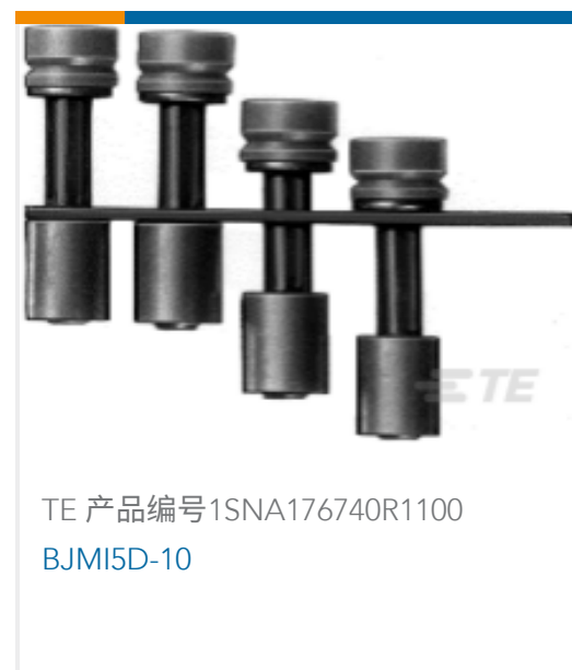
TE 产品编号1SNA176740R1100 BJM5D-10