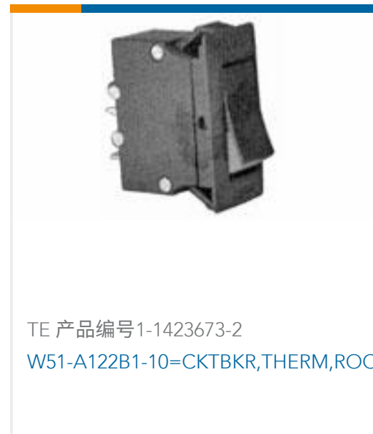
TE 产品编号1-1423673-2 W51-A122B1-10=CKTBKR,THERM,ROC