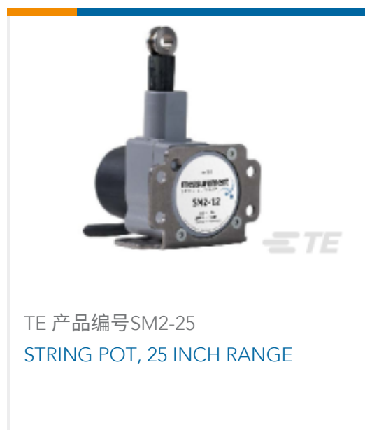
TE 产品编号SM2-25 STRING POT, 25 INCH RANGE