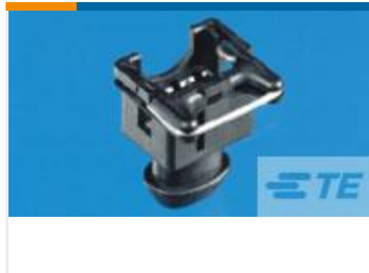
TE 产品编号282191-2 SPLASH PROOF CONN. W.S.L.