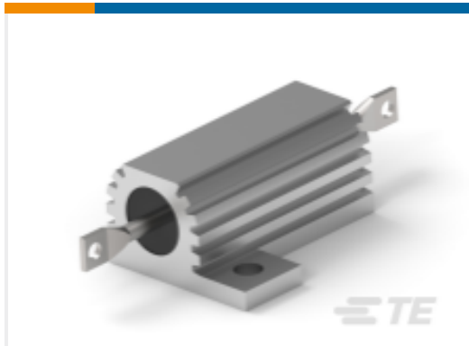
TE 产品编号1-1879071-3 功率电阻器：铝壳体，75 瓦特