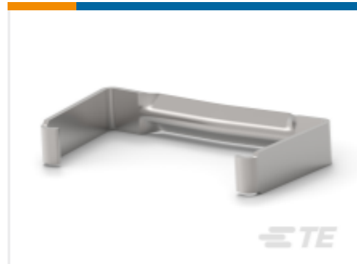
TE 产品编号4-1393560-3 V42254A4000D 9=SUB D BUEGEL