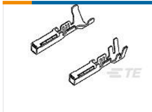
TE 产品编号345160-1 040 SERIES RECEPT.