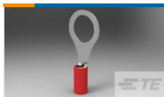
TE 产品编号328975 PIDG R 22-16COMM 22-18MIL 1/2