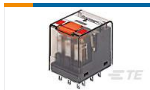
TE 产品编号9-1419111-1 PT570730