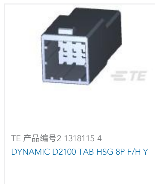
TE 产品编号2-1318115-4 DYNAMIC D2100 TAB HSG 8P F/H Y