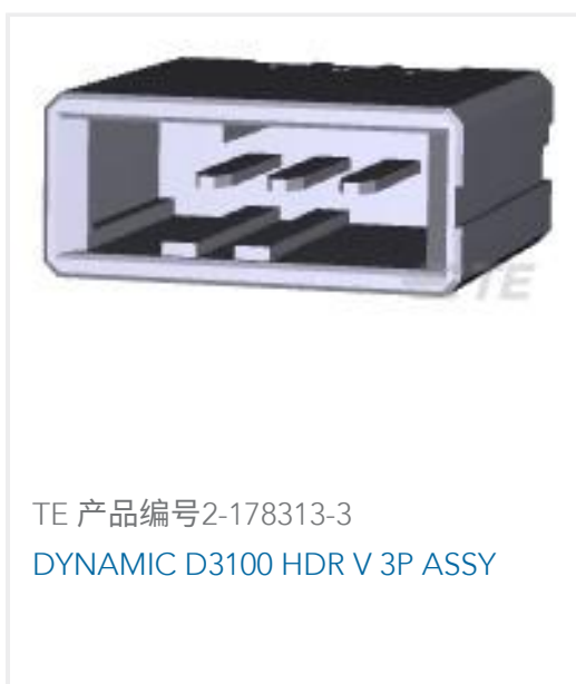
TE 产品编号2-178313-3 DYNAMIC D3100 HDR V 3P ASSY