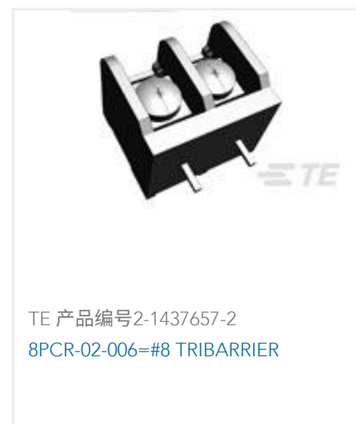
TE 产品编号2-1437657-2 8PCR-02-006=#8 TRIBARRIER