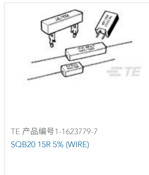
TE 产品编号1-1623779-7 SQB20 15R 5% (WIRE)