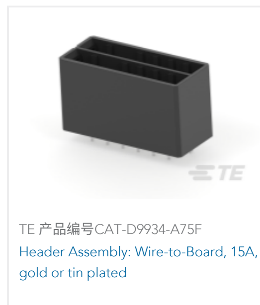
TE 产品编号CAT-D9934-A75F Header Assembly: Wire-to-Board, 15A, gold or tin plated