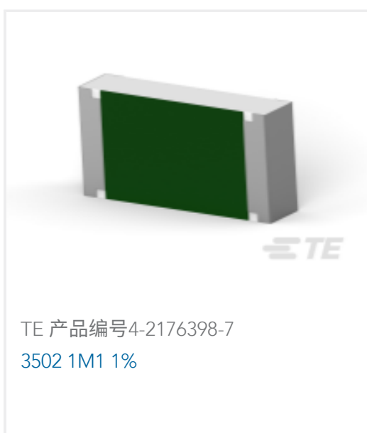
TE 产品编号4-2176398-7 3502 1M1 1%