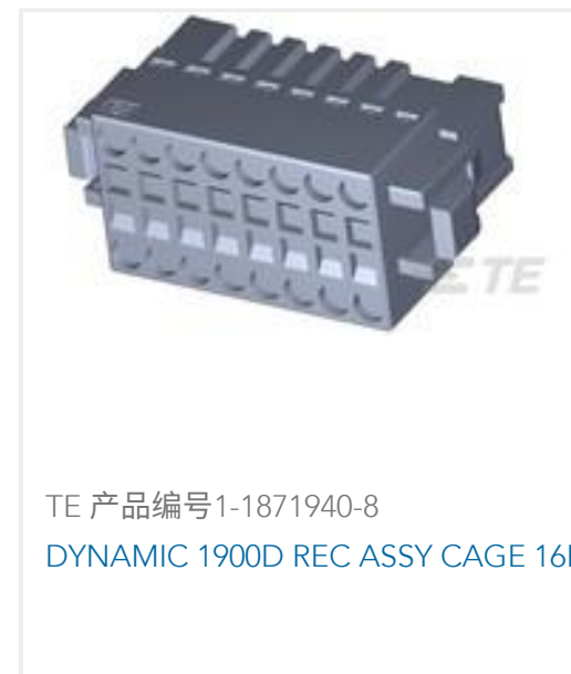
TE 产品编号1-1871940-8 DYNAMIC 1900D REC ASSY CAGE 16P