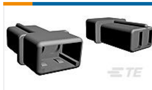
TE 产品编号1-480724-0 02P CMNL CAP HSG F/H D/L NATL