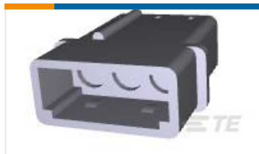
TE 产品编号1-480726-0 03P CMNL CAP HSG D/L NAT