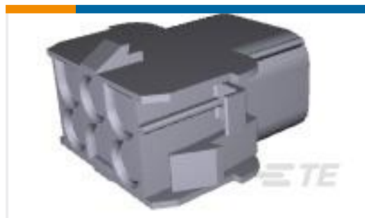
TE 产品编号794536-1 06P UMNL CAP HSG 150C BLK