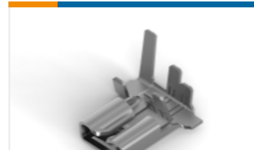
TE 产品编号2238171-3 250 FASTON,FLAG,REC.,22-12 AWG, TPBR