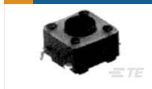
TE 产品编号2-1437565-7 FSM2JSMA=SMT,TACTILE,PB SWITCH