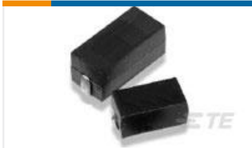
TE 产品编号8-1879233-0 SMW5 200R 5%