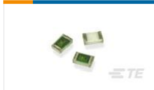
TE 产品编号1676143-2 RN 0805 100R 0.1% 10PPM 1KRL