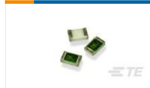
TE 产品编号1879217-4 CPF 0603 180K 0.1% 25PPM 1K RL