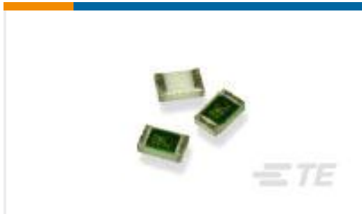
TE 产品编号9-1676481-0 CPF 0603 47K 0.1% 25PPM 1K RL