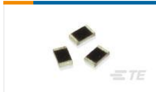
TE 产品编号1625856-4 RH73 2A 20M 10% 100PPM 1K RL