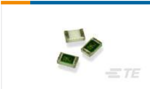
TE 产品编号8-1676481-9 CPF 0603 39K 0.1% 25PPM 1K RL