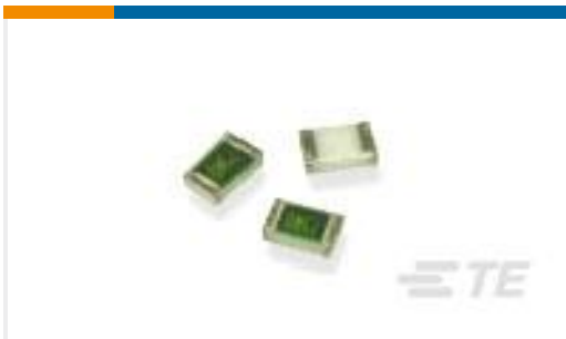
TE 产品编号2176088-6 RP 1J 0.166W 845R 0.1% 25PPM 1K RL