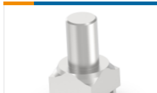
TE 产品编号225679-E POWELM STIFT VOLLM M8 13 2,54 * EP 7,5 *