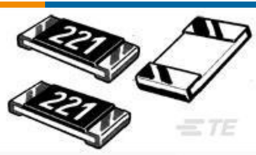
TE 产品编号1-2176230-3 3522 8R2 5% 3W