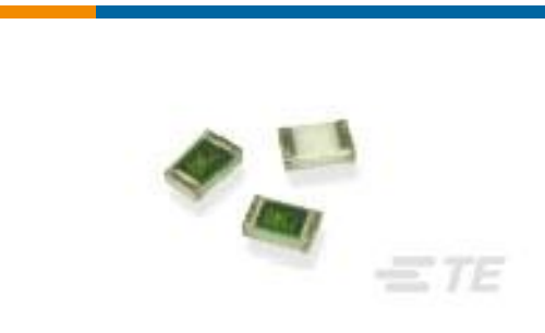
TE 产品编号3-2176089-4 RP 1J 0.166W 24K9 0.1% 25PPM 1K RL