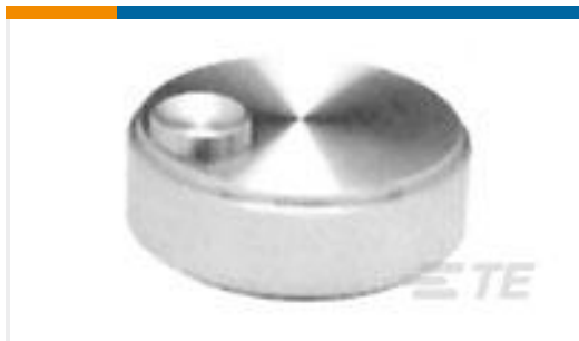
TE 产品编号3-1437622-8 KN1751BS1/4=KNOB SPINNER L/HAI