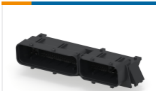
TE 产品编号2374035-1 121POS,HYBRID,HDR ASSY,90DEG,SLDR,COD 1