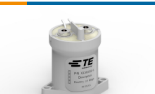
TE 产品编号2138622-1 RELAY, EVC135, 26 OHM COIL (15" WIRE)