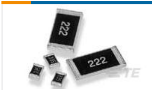
TE 产品编号1622918-1 CRG0603 1% 330R