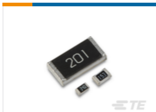
TE 产品编号2-2176327-1 CRGP 0805 470R 1%