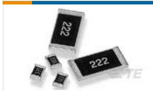
TE 产品编号1622877-1 CRG0603 1% 1M0