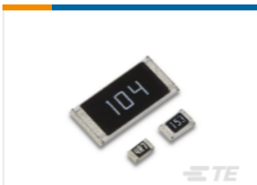
TE 产品编号1-2176349-6 CRGCQ 2512 180R 1%