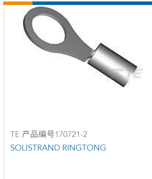
TE 产品编号170721-2 SOLISTRAND RINGTONG