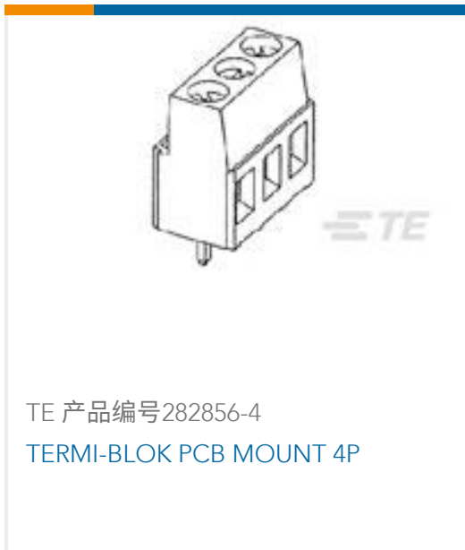
TE 产品编号282856-4 TERMI-BLOK PCB MOUNT 4P