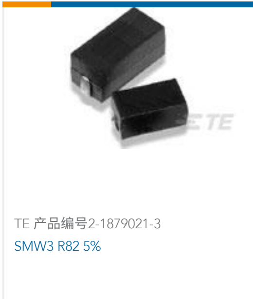
TE 产品编号2-1879021-3 SMW3 R82 5%