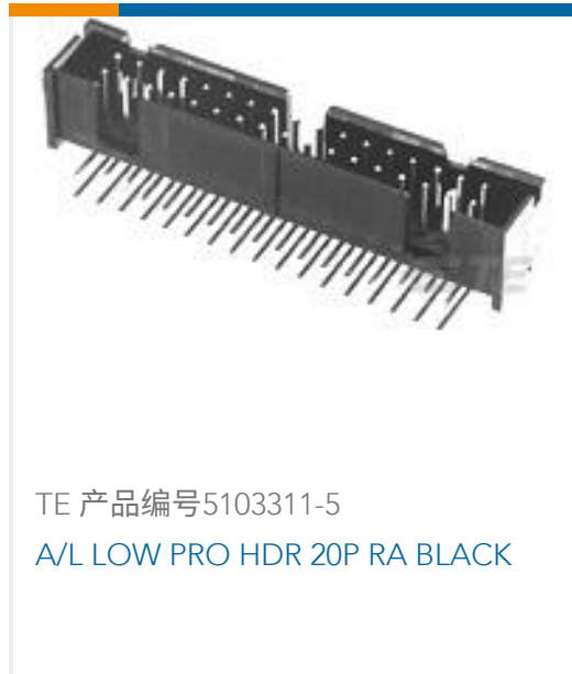
TE 产品编号5103311-5 A/L LOW PRO HDR 20P RA BLACK