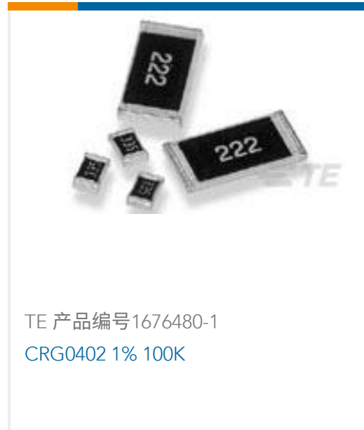
TE 产品编号1676480-1 CRG0402 1% 100K