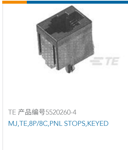
TE 产品编号5520260-4 MJ,TE,8P/8C,PNL STOPS,KEYED