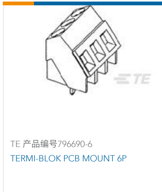
TE 产品编号796690-6 TERMI-BLOK PCB MOUNT 6P