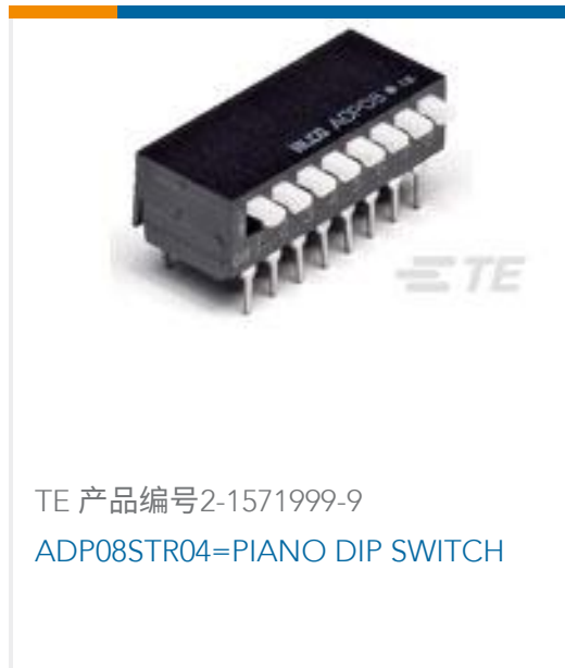
TE 产品编号2-1571999-9 ADP08STR04=PIANO DIP SWITCH