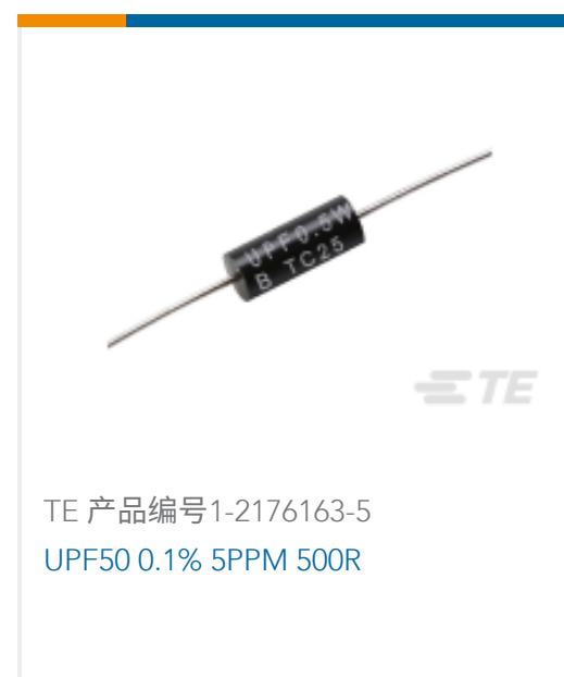
TE 产品编号1-2176163-5 UPF50 0.1% 5PPM 500R