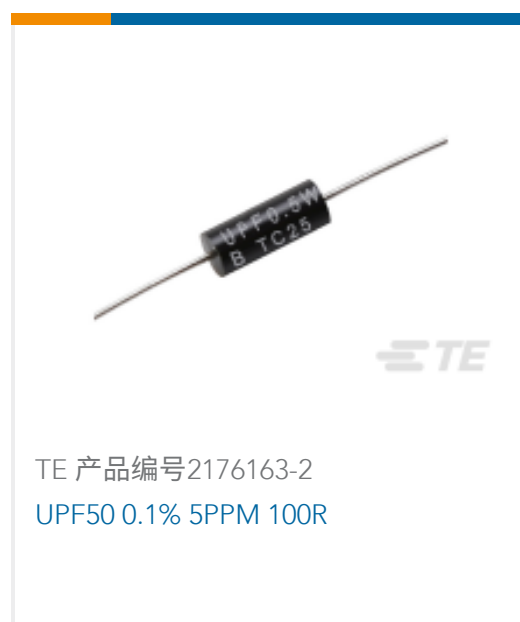
TE 产品编号2176163-2 UPF50 0.1% 5PPM 100R