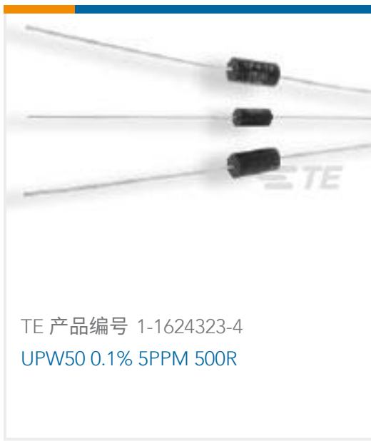
TE 产品编号 1-1624323-4 UPW50 0.1% 5PPM 500R