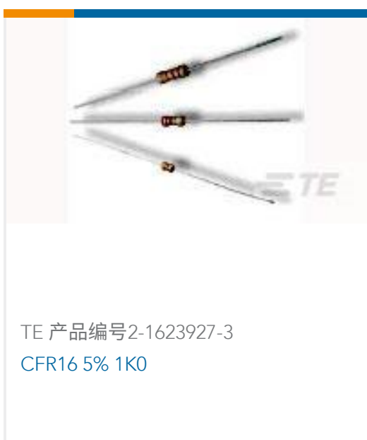
TE 产品编号2-1623927-3 CFR16 5% 1K0