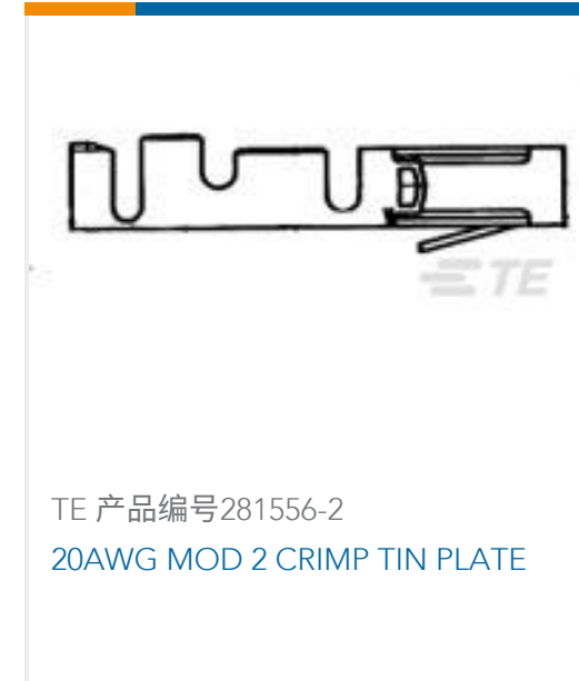
TE 产品编号281556-2 20AWG MOD 2 CRIMP TIN PLATE