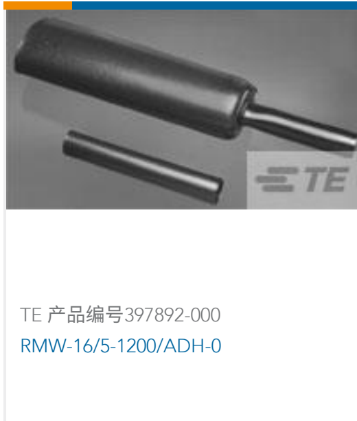
TE 产品编号397892-000 RMW-16/5-1200/ADH-0