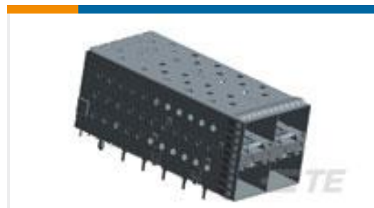
TE 产品编号2007637-8 SFP+ assy 2x2 Spring Fingers N