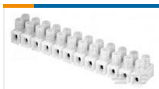
TE 产品编号1-1776293-2 TSB23012DS=EUROPA TERM BLK, 8MM