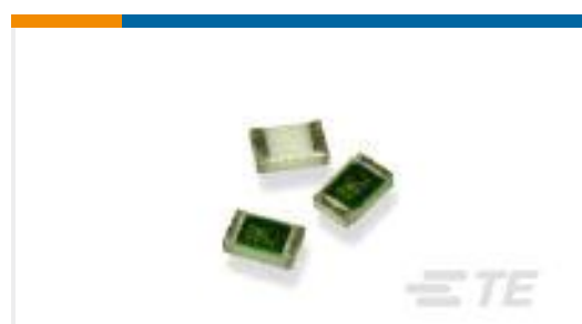
TE 产品编号3-1879216-5 CPF0402 200K 0.1% 25PPM 1K RL