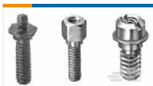
TE 产品编号750831-1 .050SR FEM SCRLCK KIT,SLIM LN