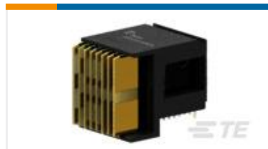
TE 产品编号1410189-3 MULTIGIG RT T2 7RW H-LFT,ET2