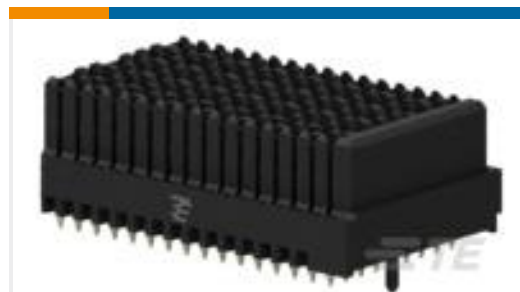
TE 产品编号1410142-1 MULTIGIG RT T2 .8" BP FULL RGH