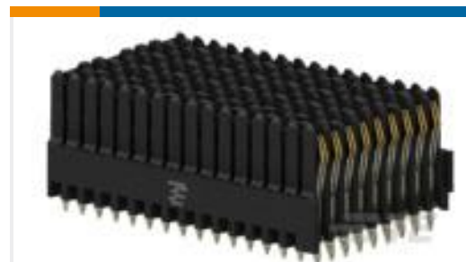
TE 产品编号1410140-1 MULTIGIG RT T2 .8" BP FULL CNT