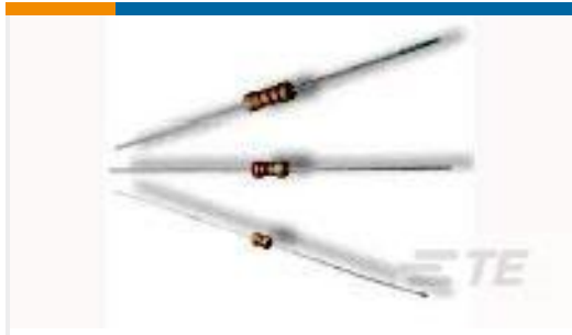
TE 产品编号 1623932-8 CFR50 5% 10K