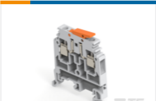
TE 产品编号1SNA115686R1300 M4/6.SNB