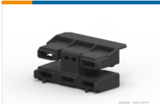
TE 产品编号2141629-1 CENTRE PLATE, 5+2 POS.