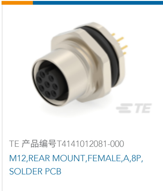
TE 产品编号T4141012081-000 M12,REAR MOUNT,FEMALE,A,8P, SOLDER PCB