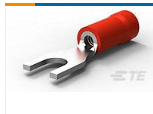
TE 产品编号34154 P.G. SPADE