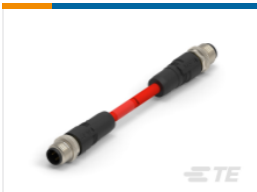
TE 产品编号TAD14741311-001 M12D4-MS-MS-PVC TYPE B RED-0.5M