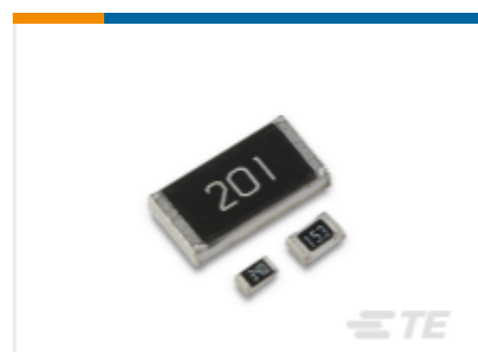
TE 产品编号2-2176328-1 CRGP 1206 470R 1%