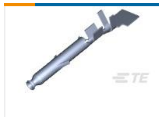
TE 产品编号770902-3 MINI UMNL SOK 26-22 AWG AU