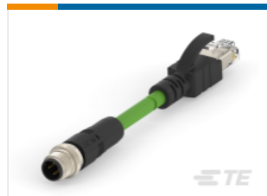
TE 产品编号TCD14741111-001 M12D4-MS-RJ-PVC-22SH-TYPE B GREEN-0.5M