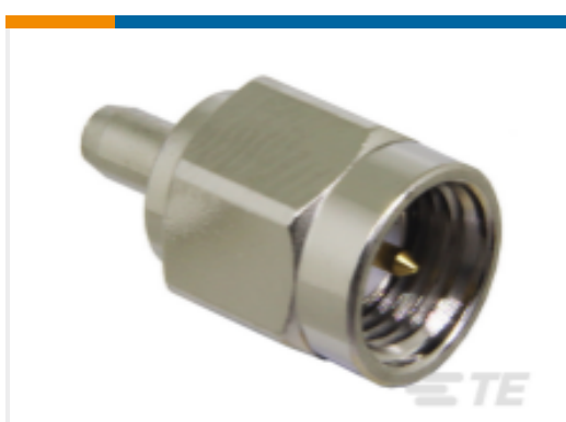
TE 产品编号CONSMA007-R178 SMA Plug 50 Ohm Cable Crimp