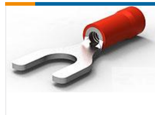
TE 产品编号34156 PG SPD 22-16 COMM 22-18 MIL 10