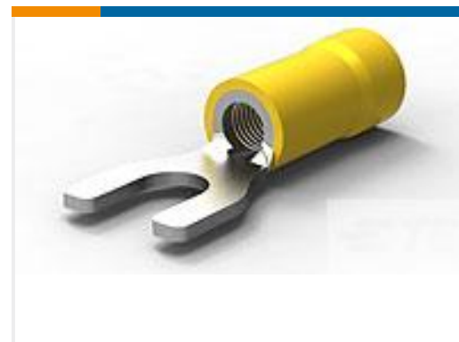
TE 产品编号34176 TERMINAL,PG SPD 12-10 10