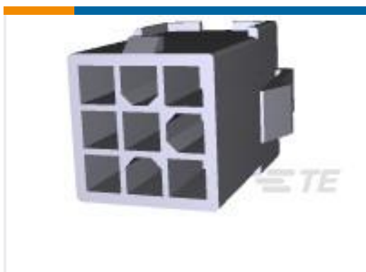
TE 产品编号172332-1 MINI UNIVERSAL MATE-N-LOK CAP HOUSING 9P