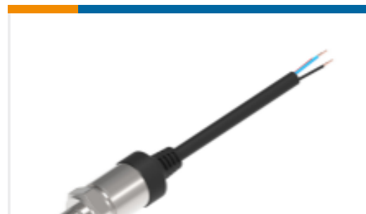
TE 产品编号20014203-12 PRESS XDCR M325M-000005-250PG