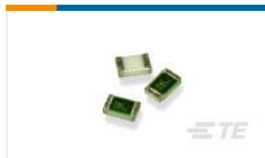
TE 产品编号1-1879208-9 CPF 0402 56R 0.1% 25PPM 1K RL