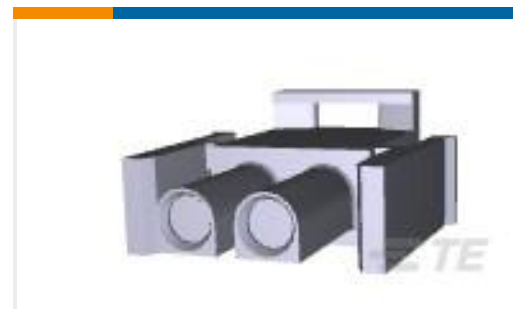
TE 产品编号350777-4 02P UMNL PLUG HSG UL94V0