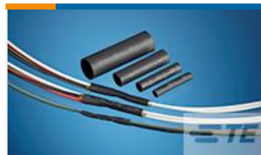
TE 产品编号1207406001 DSPL-NR1-0-50MM