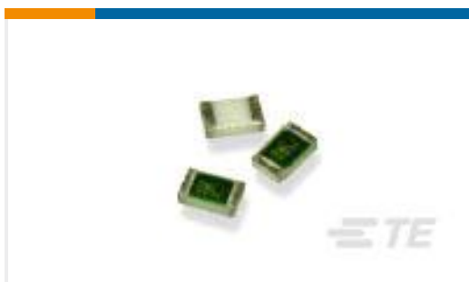
TE 产品编号8-1879213-6 CPF 0402 232R 0.1% 25PPM 1K RL