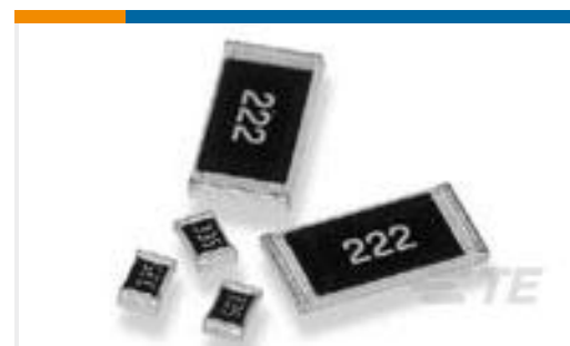
TE 产品编号1622877-1 CRG0603 1% 1M0