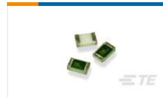
TE 产品编号9-1879212-9 CPF 0402 25R5 0.1% 25PPM 1K RL