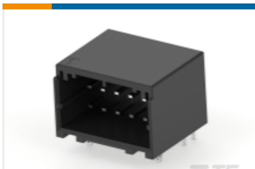
TE 产品编号1-1827876-0 Header Assembly: Wire-to-Board, 5A, gold or tin plated