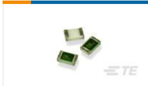
TE 产品编号5-1879337-6 CPF 0603 9K31 1% 50PPM 1K RL