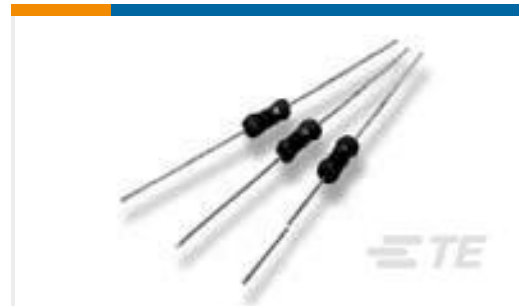
TE 产品编号9-1879352-9 RR02 5% 3K9 AMMO