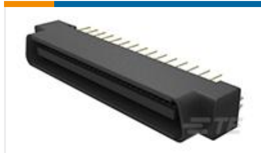
TE 产品编号1734100-4 Champ050 series,40pos,Au over PdNi