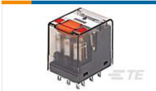
TE 产品编号5-1419111-3 PT271024