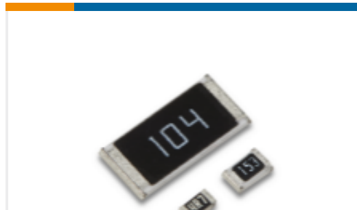
TE 产品编号2176339-9 CRGCQ 0603 47R 1%