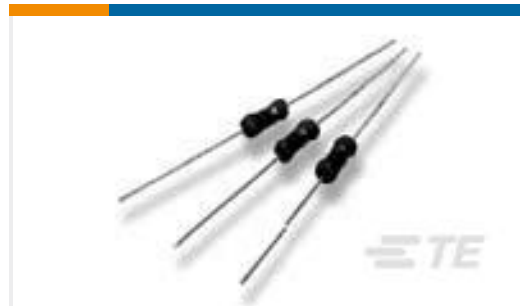
TE 产品编号1625893-6 5W SM M/OX 5% 150K