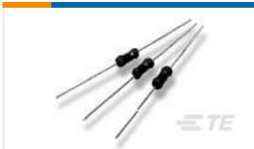
TE 产品编号1879353-6 RR02 5% 6K8 AMMO