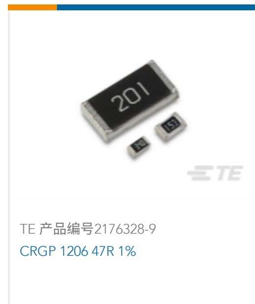
TE 产品编号2176328-9 CRGP 1206 47R 1%