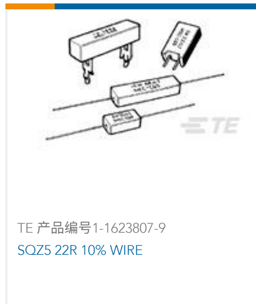
TE 产品编号1-1623807-9 SOZ5 22R 10% WIRE