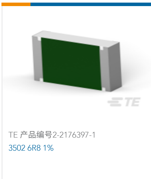
TE 产品编号2-2176397-1 3502 6R8 1%