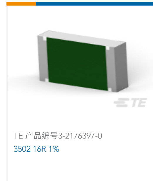
TE 产品编号3-2176397-0 3502 16R 1%