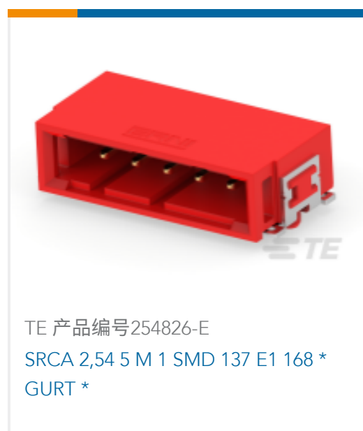
TE 产品编号254826-E SRCA 2,54 5 M 1 SMD 137 E1 168 * GURT *