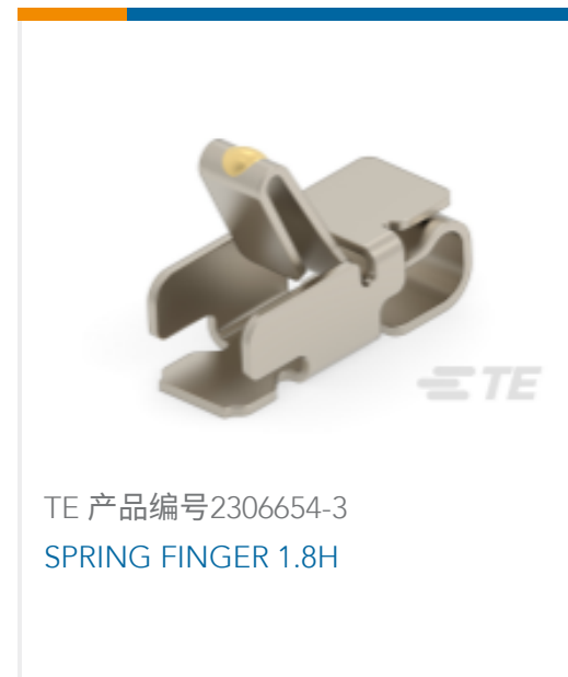
TE 产品编号2306654-3 SPRING FINGER 1.8H