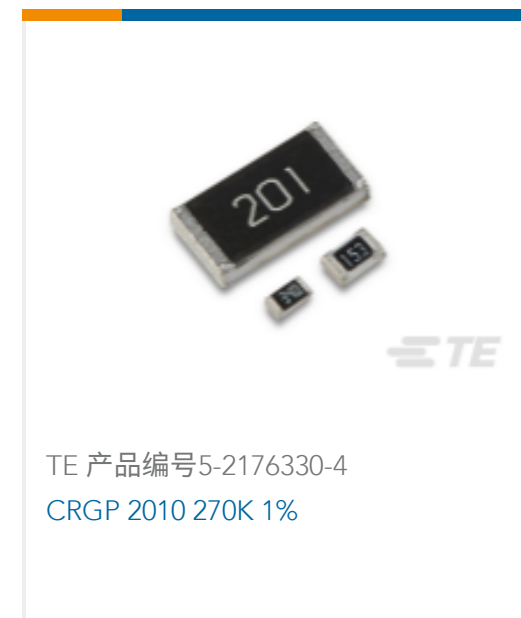
TE 产品编号5-2176330-4 CRGP 2010 270K 1%