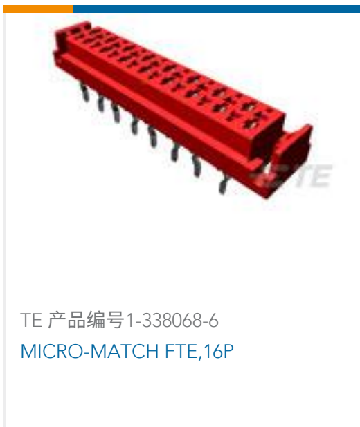
TE 产品编号1-338068-6 MICRO-MATCH FTE,16P