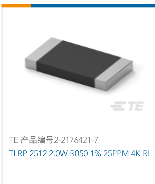
TE 产品编号2-2176421-7 TLRP 2512 2.0W R050 1% 25PPM 4K RL