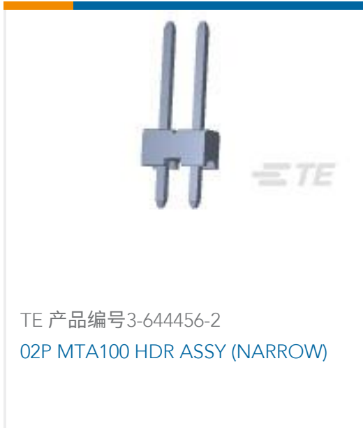
TE 产品编号3-644456-2 02P MTA100 HDR ASSY (NARROW)