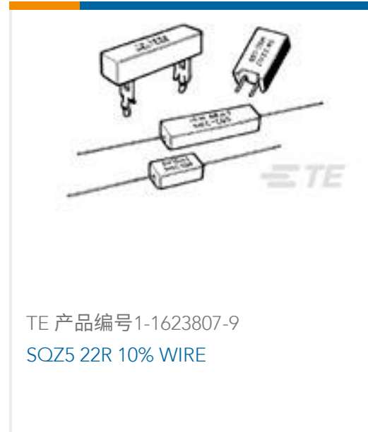
TE 产品编号1-1623807-9 SQZ5 22R 10% WIRE