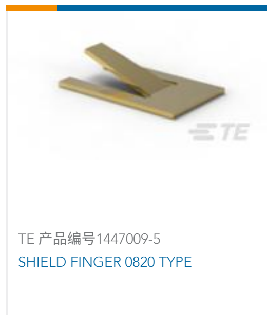
TE 产品编号1447009-5 SHIELD FINGER 0820 TYPE