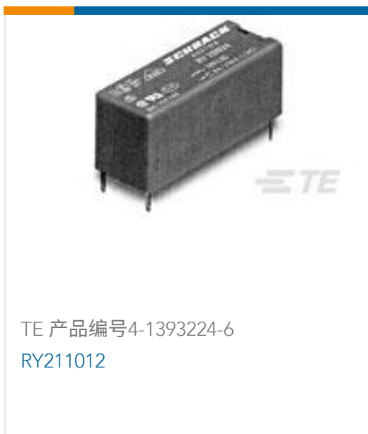
TE 产品编号4-1393224-6 RY211012