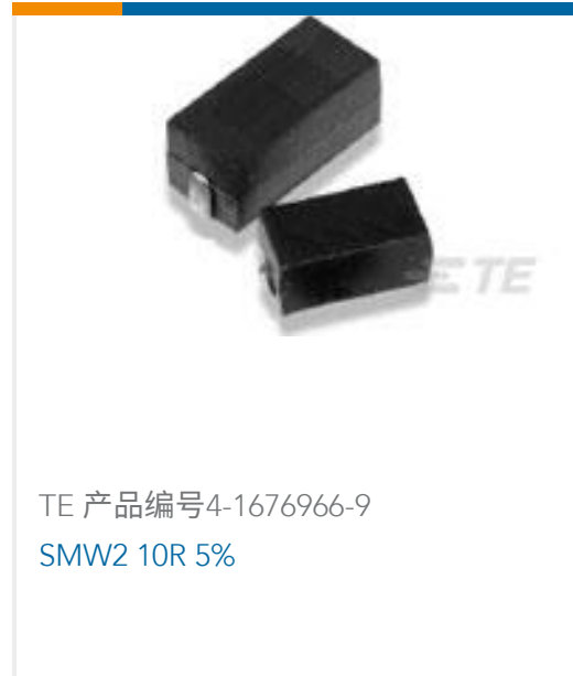
TE 产品编号4-1676966-9 SMW2 10R 5%