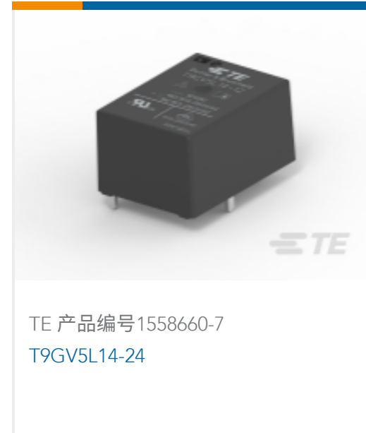
TE 产品编号1558660-7 T9GV5L14-24