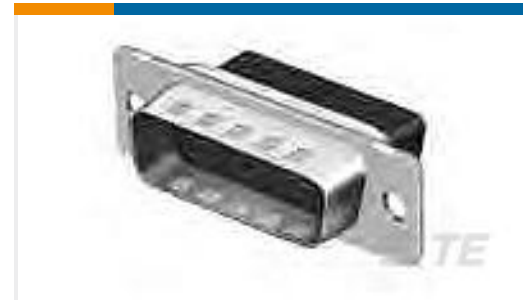
TE 产品编号167294-1 25P HDP20 PLUG ASSY