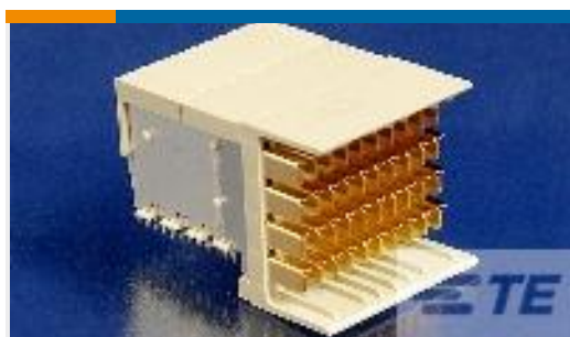
TE 产品编号6469048-1 HMZD 4PR RA HDR 80P ASSY LF