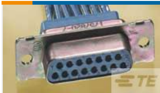
TE 产品编号207463-1 CRIMP SNAP RCPT ASSY, SZ 3