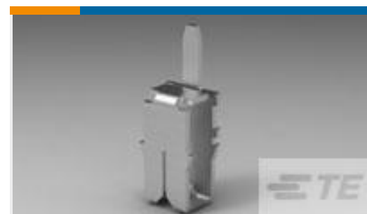
TE 产品编号63659-1 MAG-MATE POST 27-23 016TPCUBR