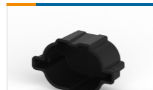
TE 产品编号9-2208100-1 PROTEC. COVER 8MM HV, 2POS PINHEADER