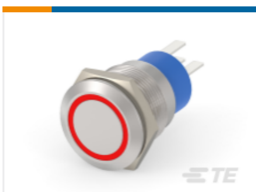
TE 产品编号2-2213767-7 AV19 SPL 5A MOVE RING LED RED 24V