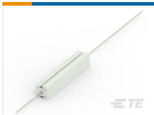
TE 产品编号1623730-4 线绕电阻器：垂直安装