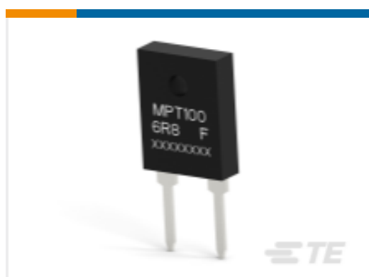
TE 产品编号1-2176429-0 MPT100 3R3 5%