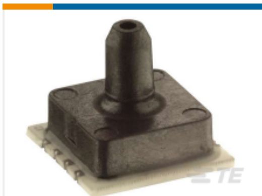
TE 产品编号1451-015A-N 15PSIA NARROW BOARD MNT PRESSURE SENSOR