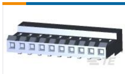
TE 产品编号4-640426-0 10P MTA156 CONN ASSY 18AWG ORA