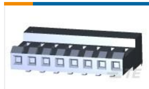
TE 产品编号3-640428-8 08P MTA156 CONN ASSY 22AWG RED