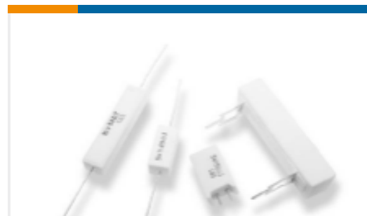
TE 产品编号1623783-7 线绕电阻器：垂直安装