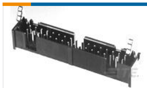
TE 产品编号2-1761608-6 IDC LOW PRO HDR 16P VERT SHT L