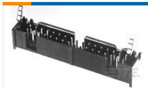
TE 产品编号3-1761608-1 IDC LOW PRO HDR 34P VERT SHT L