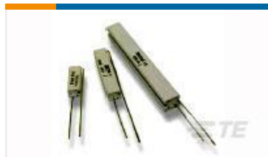
TE 产品编号1623728-7 BCHE 11 W 1K0 5%