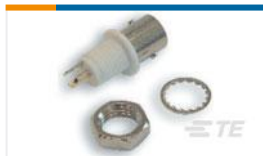
TE 产品编号1-1337450-0 BNC BHSkt + TAG 50Ohm Silver Pltd