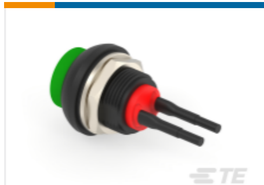
TE 产品编号2329359-9 PB ON/OFF HC GRE M1 TERM IP68 500MM LHS