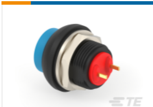
TE 产品编号2-2329328-0 PB OFF/ON HC BLU M4 TERM. IP68