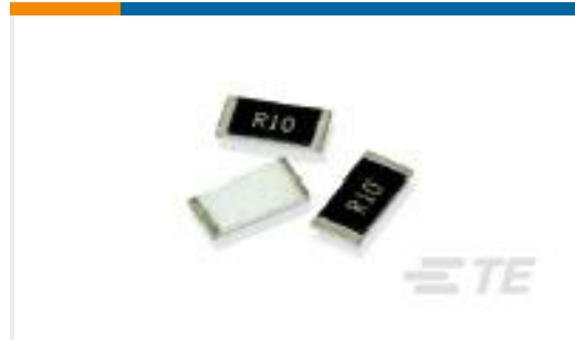
TE 产品编号2-1879461-5 RL73H 2A R13 1% 1K RL