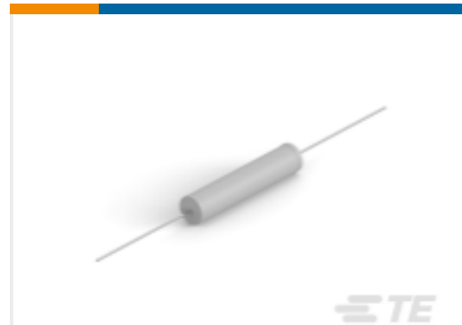
TE 产品编号9-2176415-0 8W STD M/OX 5% 150K