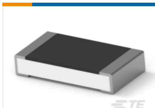
TE 产品编号1-2176391-0 RQ 1206 15K4 0.1% 10PPM 5K RL