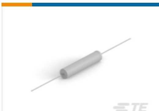
TE 产品编号9-2176415-1 8W STD M/OX 5% 160K