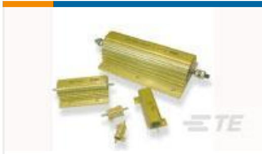
TE 产品编号9-1625971-5 HSA25 R01 10%