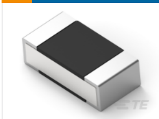
TE 产品编号3-2176307-2 RP 1E 0.1W 26K1 0.1% 25PPM 5K RL