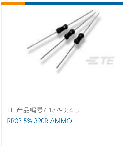
TE 产品编号7-1879354-5 RR03 5% 390R AMMO