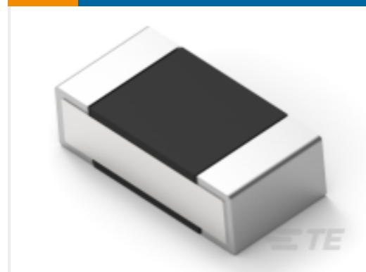
TE 产品编号7-2176305-3 RP 1E 0.1W 604R 0.1% 25PPM 5K RL