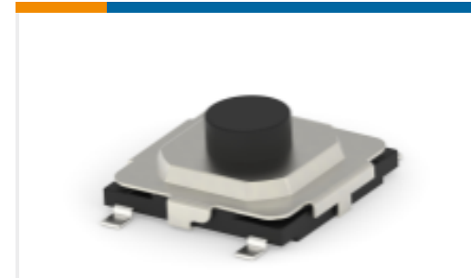
TE 产品编号2337238-3 TACT MINI GW 5.2X5.2X2 160GF