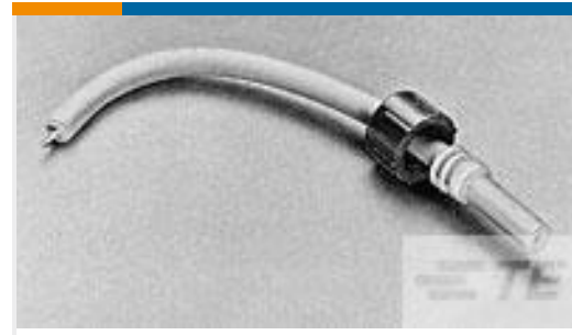
TE 产品编号1-830611-0 LGH 1/2 SNGL MLD END