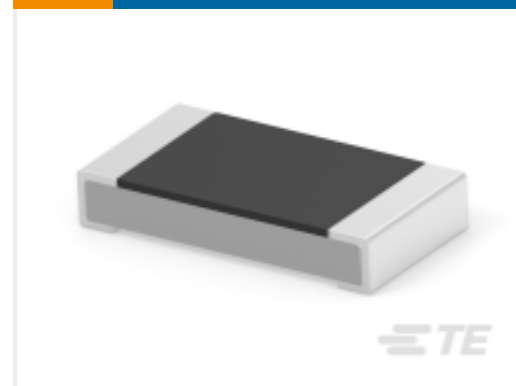
TE 产品编号2-2176392-9 RQ 1206 261K 0.1% 10PPM 5K RL