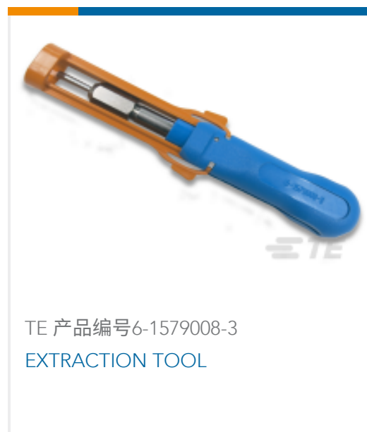
TE 产品编号6-1579008-3 EXTRACTION TOOL