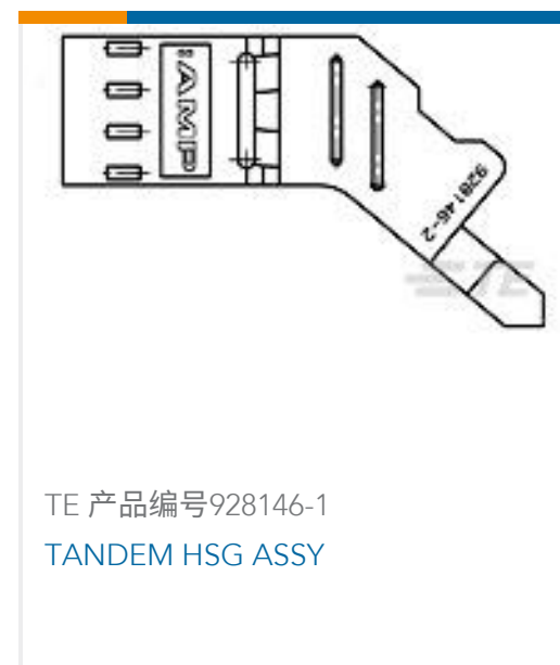
TE 产品编号928146-1 TANDEM HSG ASSY