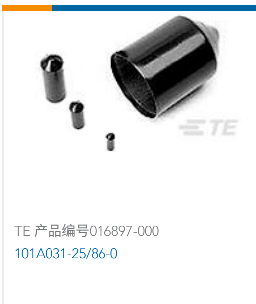
TE 产品编号016897-000 101A031-25/86-0