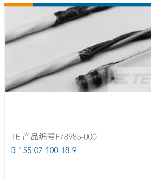
TE 产品编号F78985-000 B-155-07-100-18-9