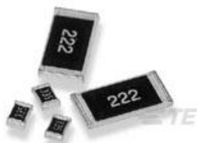
TE 产品编号 1622829-1 CRG0603 1% 10K