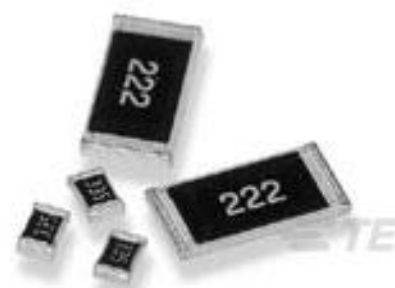
TE 产品编号 1623097-1 CRG0805 1% 10K