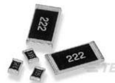
TE 产品编号 1676480-1 CRG0402 1% 100K