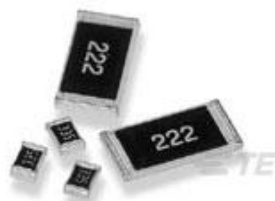
TE 产品编号 1623404-1 CRG1206 1% 10K