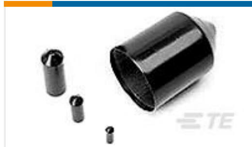
TE 产品编号843052-000 101A052-3-0