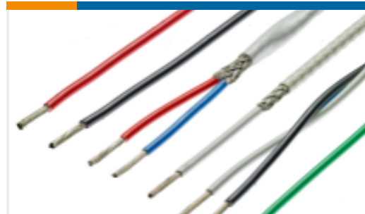
TE 产品编号CQ93033001 FLDWC0311-1.00-0CK0202/1