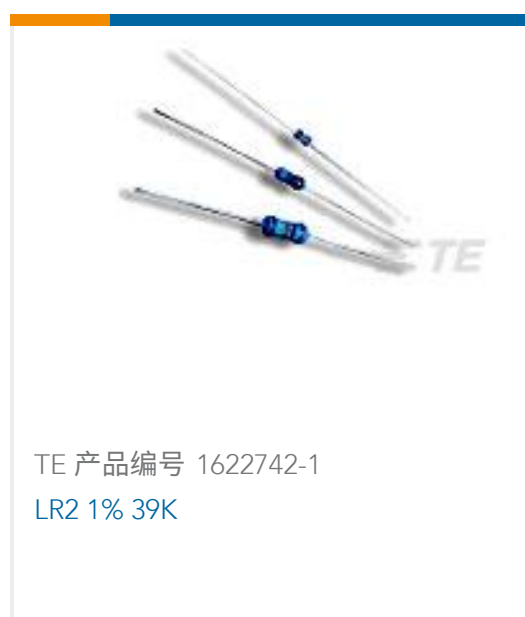
TE 产品编号 1622742-1 LR2 1% 39K