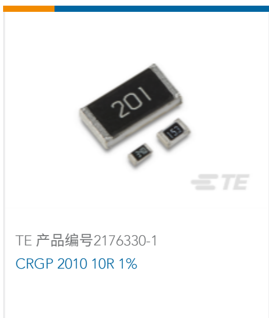
TE 产品编号2176330-1 CRGP 2010 10R 1%