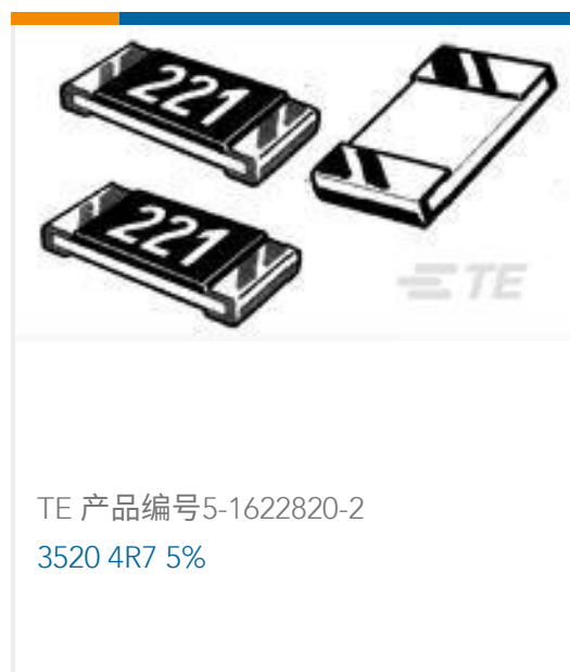
TE 产品编号5-1622820-2 3520 4R7 5%