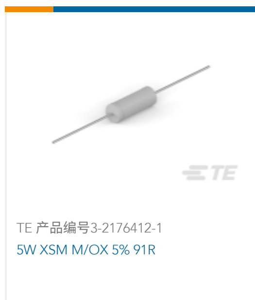
TE 产品编号3-2176412-1 5W XSM M/OX 5% 91R