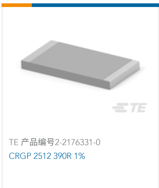
TE 产品编号2-2176331-0 CRGP 2512 390R 1%