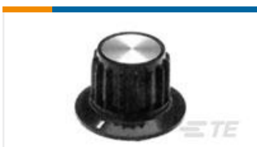
TE 产品编号1-1437624-7 PKA90B1/4=KNOB PLASTIC 1/4 IN