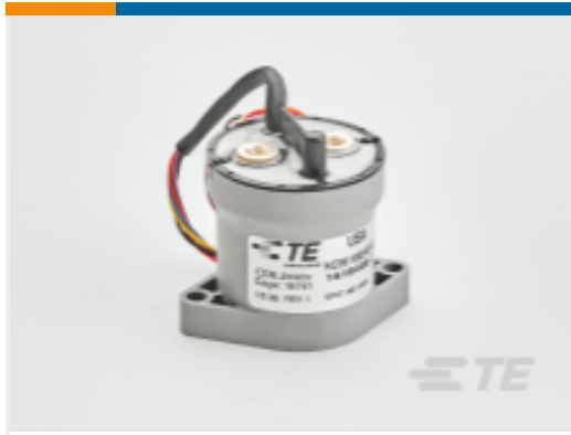
TE 产品编号 1618408-3 KCS01X024EACA=CONTACTOR, CURRENT SENSE