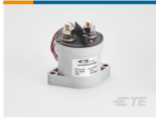
TE 产品编号 1618408-5 KCS03X024EAAA=CONTACTOR, CURRENT SENSE