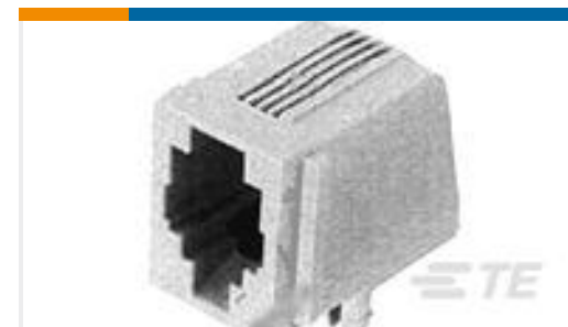
TE 产品编号5520426-4 MJ,R/A,8P