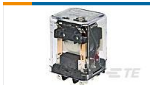
TE 产品编号8-1393113-7 KUEP-11D15-24=KU-