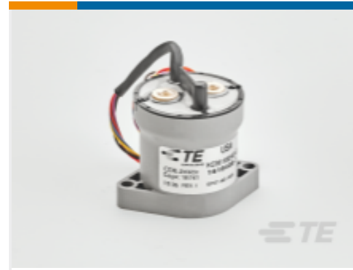
TE 产品编号 3-1618406-0 KCS01X012EACA=CONTACTOR, CURRENT SENSE,