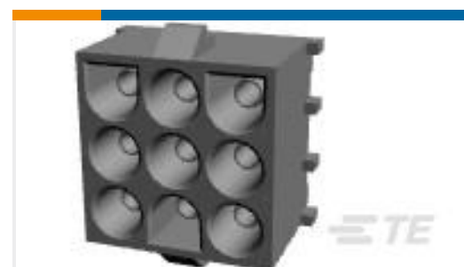
TE 产品编号1586879-1 09P UMNL SKT HDR ASSY, GW