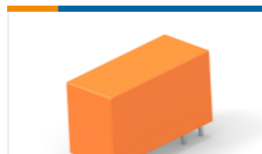
TE 产品编号2-1649329-8 RT444005