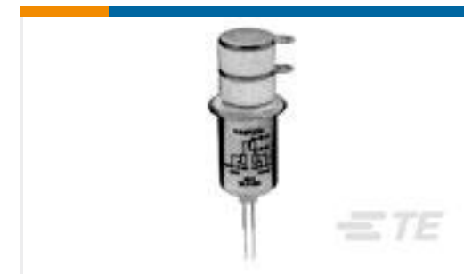
TE 产品编号5-1618240-0 K44P334=RELAY, VACUUM SPST LAT