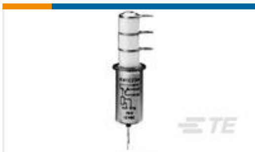
TE 产品编号5-1618239-0 K41C334=RELAY, VACUUM, SPDT