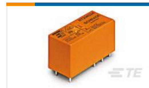
TE 产品编号1-1649326-5 RT114024