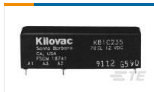
TE 产品编号6-1618241-0 K81C335=RELAY, VACUUM, SPDT