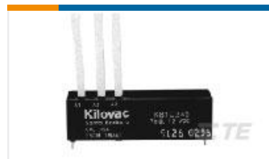
TE 产品编号5-1618241-7 K81C245=RELAY, VACUUM, SPDT