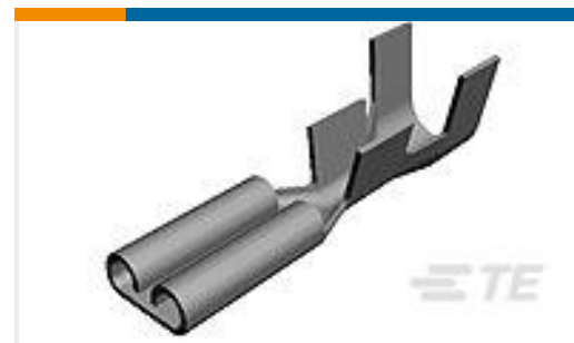
TE 产品编号41729-2 250 FASTON REC 18-16 AWG TPBR