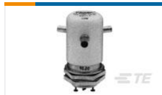
TE 产品编号3-1618278-4 KC-18=RELAY, VACUUM, SPDT