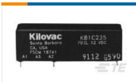
TE 产品编号5-1618241-6 K81C235=RELAY, VACUUM, SPDT